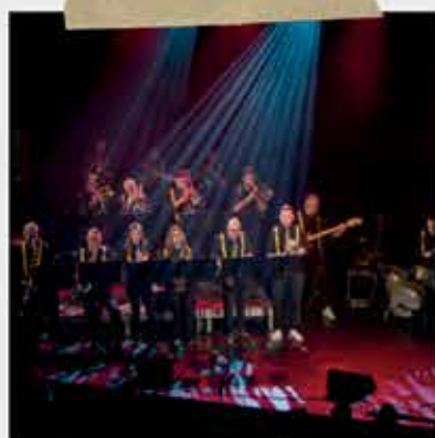
Big Band 241