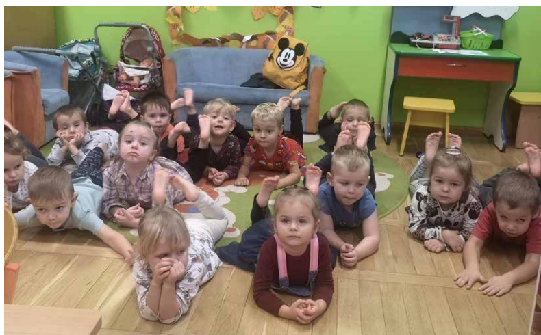
Skarpetki odpoczywają.