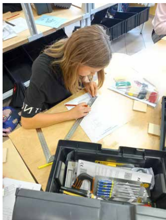
Bez techniki ani rusz.