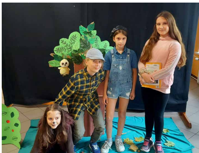
Gramy!

„Prawdziwych przyjaciół poznajemy w biedzie” - to morał, który płynie z utworu Adama Mickiewicza o wiele mówiącym tytule „Przyjaciele”.