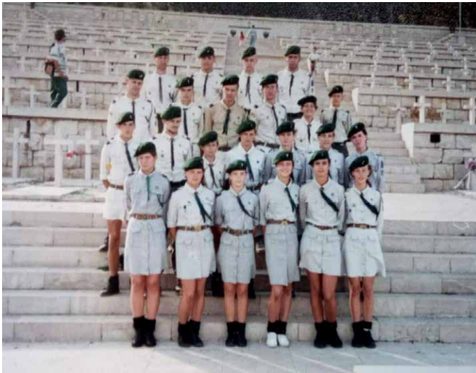
Harcerze z 8. Skockiej Drużyny Harcerskiej na obchodach 50-lecia Bitwy o Monte Cassino 1994

Jednostka komandosów nosiła nazwę 1. Samodzielnej Kompanii „Commando” i wstąpiła się między innymi walkami w ramach 2. Korpusu Polskiego we Włoszech, w tym w walkach pod Monte Cassino.