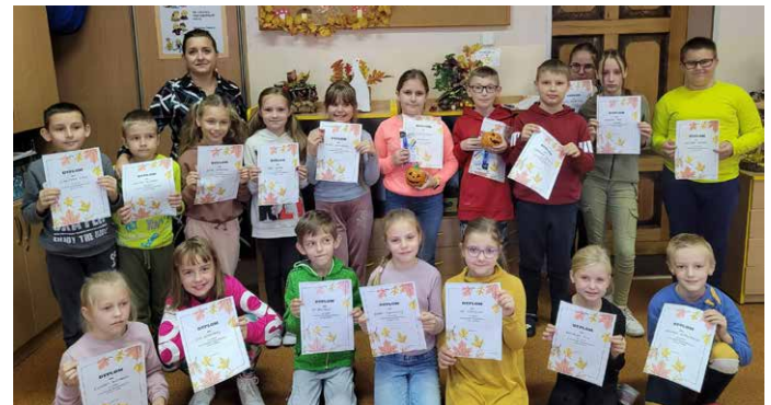
Konkursowa załoga.

Październik to szczególny miesiąc w życiu bibliotek. Jest to czas obchodów Międzynarodowego Miesiąca Bibliotek Szkolnych.