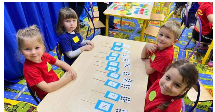
To przecież proste.

Na zakończenie olimpiady wszyscy zostali zaproszeni na poczęstunek.