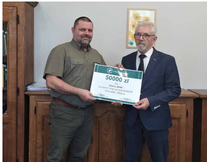
Umowa podpisana, czek w rękę.

Gmina Skoki jest jedną z trzech jednostek samorządu terytorialnego, które zawarły korzystne umowy z Lasami Państwowymi.