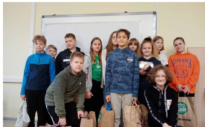
Wolontariusze z klasy 6c z darami.

Uczniowie klasy 6c Szkoły Podstawowej im. A. Mickiewicza w Skokach zjawili się 19 października w Archidiecezjalnym Domu Rekolekcyjnym w Rościnnie z darami dla przebywających tam gości z Ukrainy.