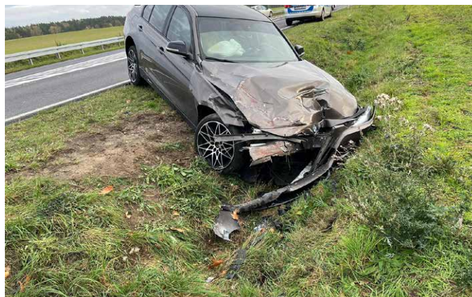
Rozbity samochód przy drodze nr 196.