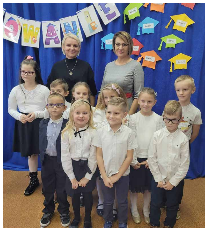
Oto pierwszoklasiści w Rejewcu.