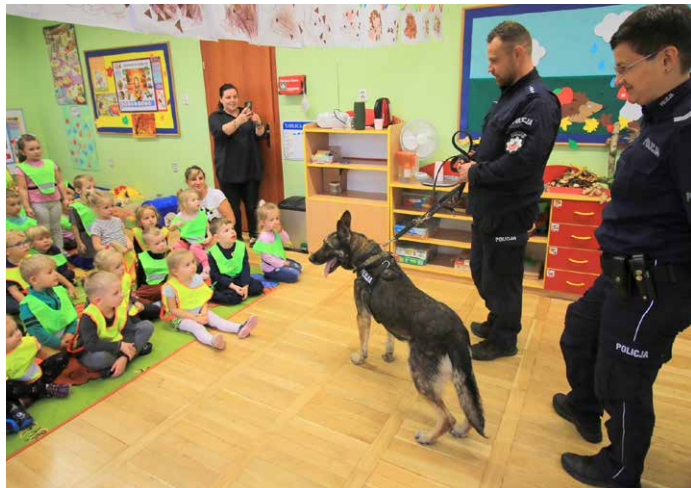
Pies przyuczony jest do specjalnych zadań.

Kontynuacją akcji „Bądź widoczny – Świeć przykładem” była wizyta 12 października w Przedszkolu Samorządowym im. Kubusia Puchatka w Skokach, zorganizowana w ramach współpracy z Komendą Powiatową Policji w Wągrowcu.