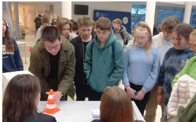
Nasi uczniowie podczas zajęć.

30 września 2022 roku uczniowie klas 8 wybrali się na zajęcia w ramach Nocy Naukowców organizowanej na Uniwersytecie Adama Mickiewicza.