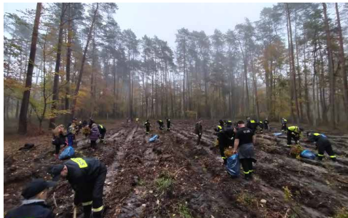
Strażacy sadzą las.