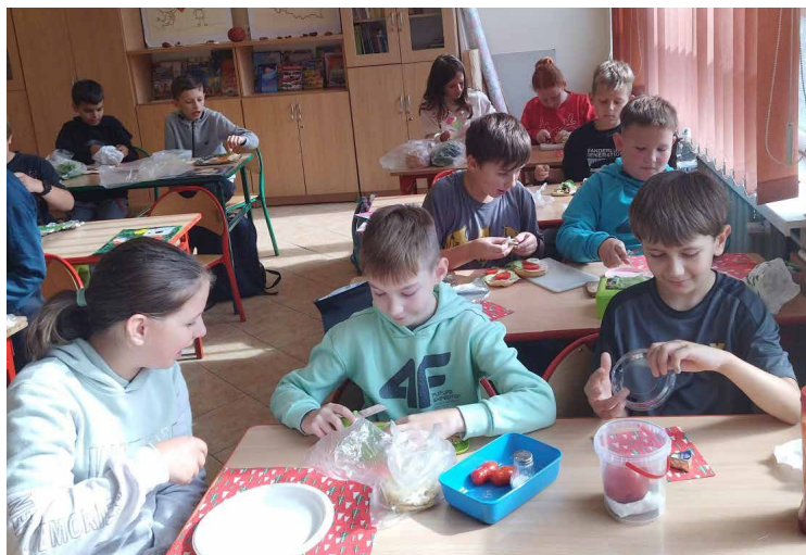
Aby zdrowo jeść.