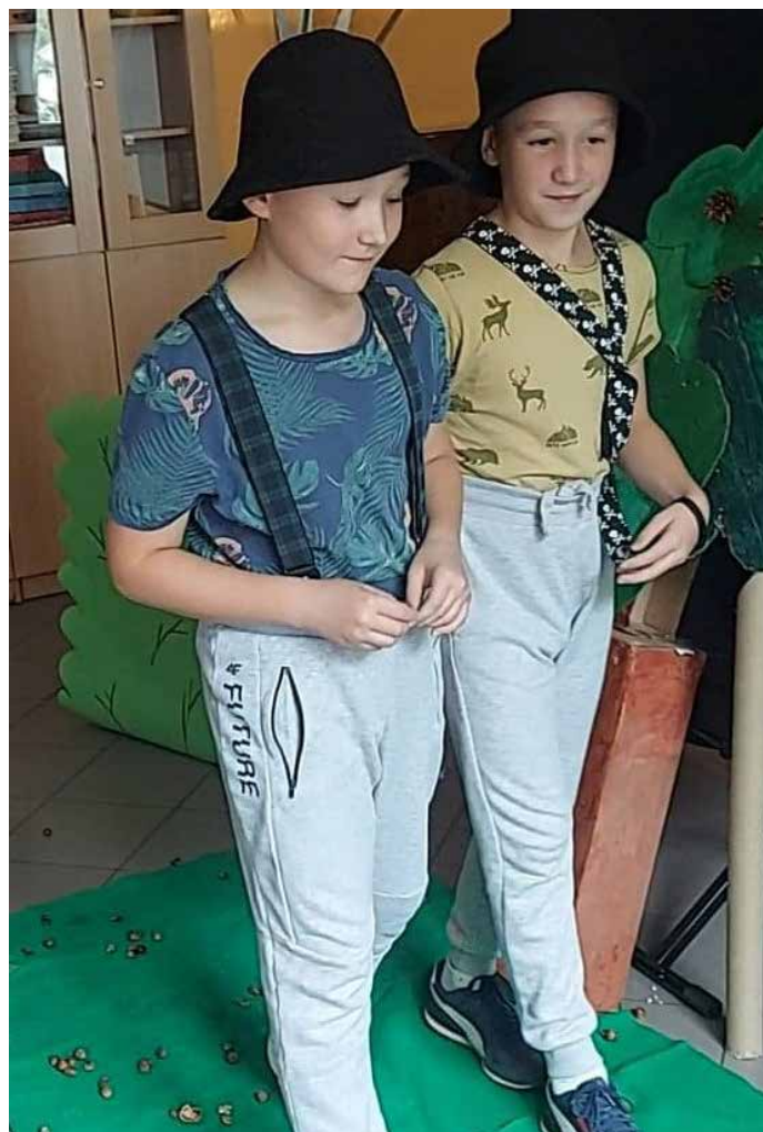
Dwaj przyjaciele.

Piątoklasiści, którzy już w czwartej klasie połączyli bakcyła teatralnego (inscenizowali „Panią Twardowską” i „Legendę o warszawskim Bazyliśku”) sami wyszli z inicjatywą przygotowania kolejnego przedstawienia. Tym razem wcieli się w rolę Leszka i Mieszka, których w cieniu dąbrowy przestraszył niedźwiedź. Tak jak i wcześniej, uczniowie samodzielnie (przy wsparciu rodziców) przygotowali scenografię, stroje oraz rekwizyty. Sami zajęli się podziałem ról i odbywali próby w wybranych przez siebie grupach, tworząc tym samym okazję do wspaniałej zabawy w realnym świecie. Odtwarzanie treści utworu skłaniało ich do zapamiętywania, koncentrowania uwagi na określonej działalności, kulturze mówienia i zachowania się.