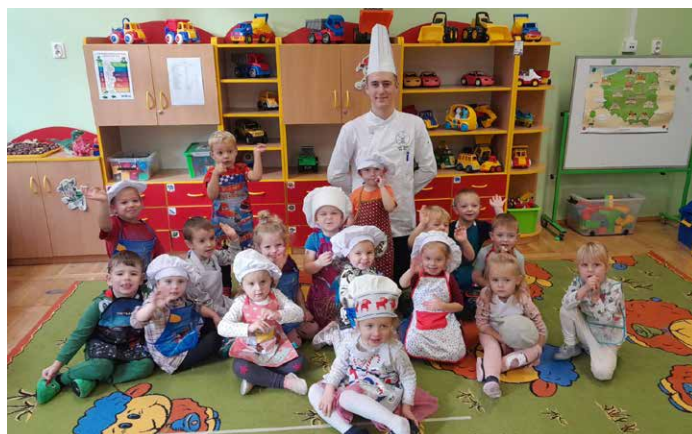
Mistrz i jego uczniowie.

Dzieci w czasie zajęć kulinarnych poznały składniki i sposób przygotowania rogali. Z wielkim zaangażowaniem wałkowały ciasto, formowały rogaliki, nadziewały je powidłami oraz lukrowały. Zapach ciepłych rogalików unosił się w całym przedszkolu.