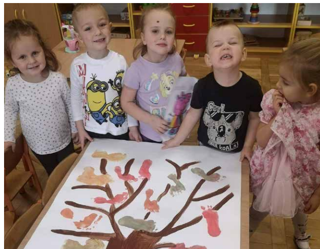
Jakie śliczne liście.