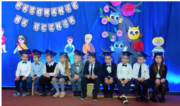
Pierwszoklasiści z Jabłkowa.

Tradycją naszej szkoły jest, że najmłodszy uczniowie w październiku przeżywają swoją pierwszą ważną uroczystość jaką jest pasowanie na ucznia pierwszej klasy.