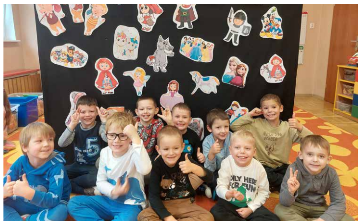
My i nasi znajomi z bajek.

4 listopada przedszkolaki z grupy Sowy I wzięły udział w bajkowych zajęciach, podczas których opowiadały o swoich ulubionych bajkowych postaciach.