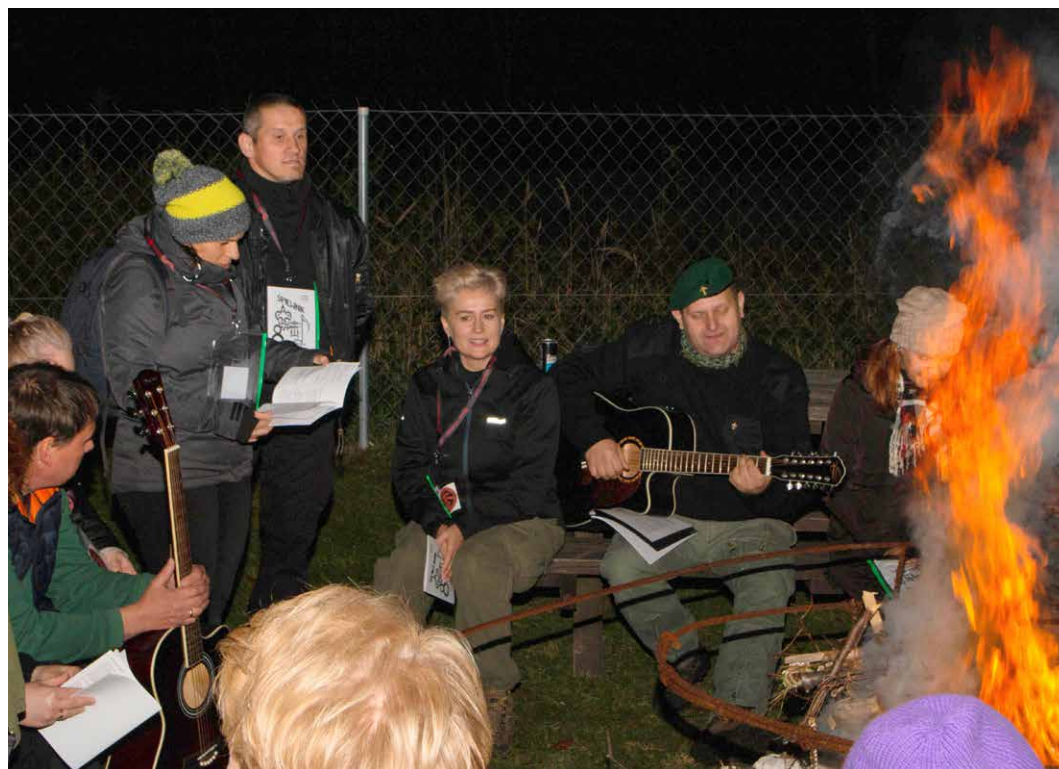
Potrzezano – 21.10.2022 r.

Przez ponad 15 lat działalności 8. Skocka Drużyna Harcerska Zielone Berety zgromadziła w swych szeregach ponad 100 osób. Połączyło ich wiele przeżytych wspólnie wspaniałych chwil, rajdy, biwaki, zdobywanie umiejętności nawiązujących do działań komandosów: wspinaczki, przepraw, biegów z mapą na orientację, ale też wiele wspólnych ognisk, zaśpiewanych piosenek, harcerskich gawęd. Wspólnie zobaczyli wiele niezwykłych miejsc, wtedy jeszcze trudno dostępnych dla młodych ludzi – Londyn, Oxford, Rzym, Wiedeń, Neapol.