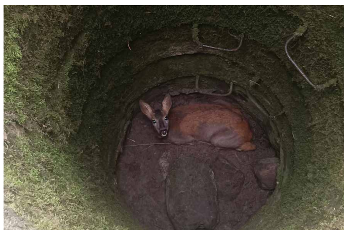
Sarna została uratowana.