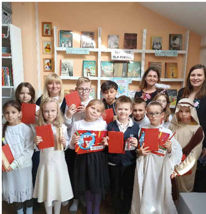
My, wkręceni w czytanie.

Naszą lechlińską bibliotekę odwiedziły dzisiaj Panie pracujące w Banku Gospodarstwa Krajowego, który realizuje szereg projektów w tym także program „Wolontariat jest super!”, z którego pozyskaliśmy środki na remont naszej czytelnicy.