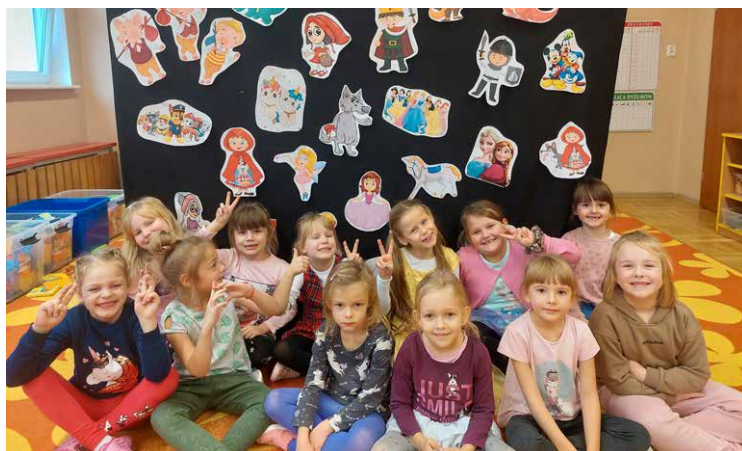
To też znajomi naszych koleżanek.

A to wszystko z okazji Międzynarodowego Dnia Postaci z Bajek. Dzieci bardzo dobrze znają bohaterów swoich ulubionych książek. Każdy świetnie poradził sobie z zadaniami – rebusami, zagadkami, zabawami muzycznymi. Na koniec dzieci namalowały swoich ulubionych bohaterów. Dzień Postaci z Bajek jest doskonałą okazją do rozwijania zainteresowań czytelniczych wśród dzieci. Bajki kształcą w dzieciach odpowiednie postawy moralne, rozwijają dziecięcą fantazję, pamięć, bogactwo słownictwo. Warto wybierać więc takie, gdzie dobro zawsze zwycięża.