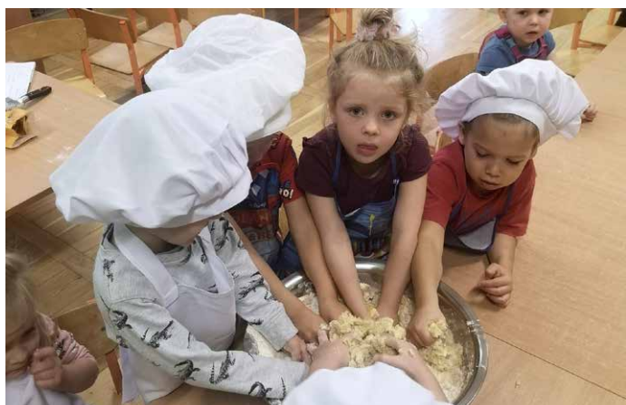
Ciasto należy dobrze wyrobić.