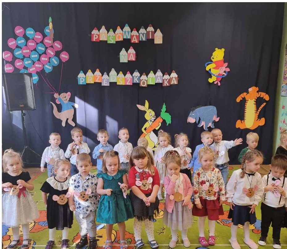
Jesteśmy we właściwym miejscu.

28 października do grona naszego przedszkola dołączyli nowi, mali, odważni i dzielni śmiałkowie, którzy uroczystościom zostali pasowani na przedszkolaków.