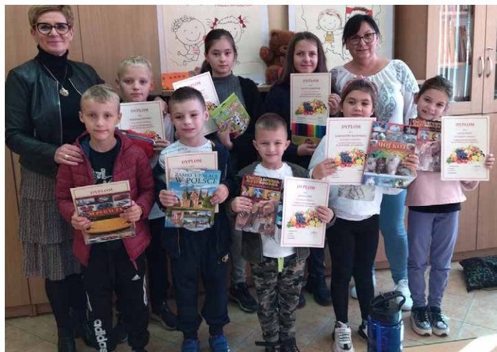
Były nagrody i wyróżnienia.