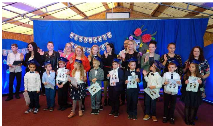
Rodzice też ślubowali.

Pierwsze 1,5 miesiąca to czas na poznanie szkoły, jej zwyczajów, zdobycia nowych wiadomości i umiejętności. Wszystkie te działania mają przygotować dzieci do wielkiego wydarzenia – ślubowania.