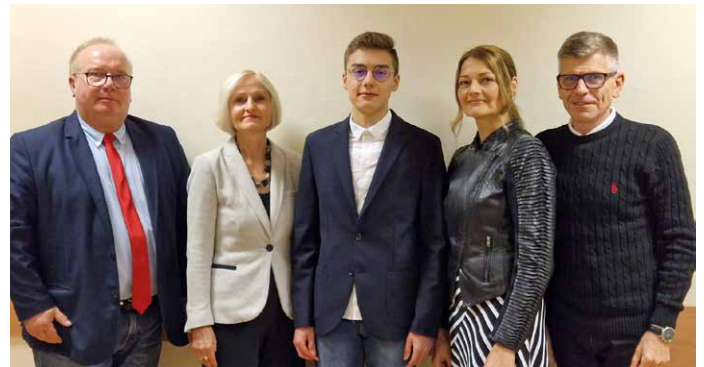
Laureat w towarzystwie dyrektora szkoły, wychowawczynie i rodziców.