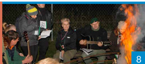
HISTORIA ZAPISANA W MOGIŁACH