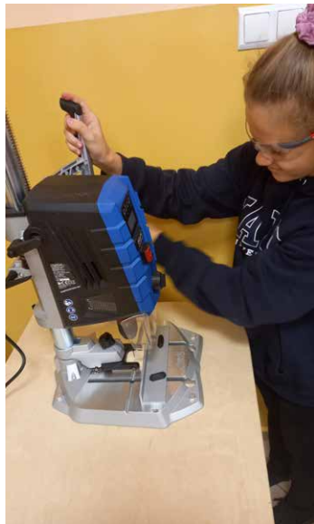
Elektronarzędzia są bardzo przydatne.

Dzięki pomocom (wiertarki stołowe, szlifierki, wiertarko - wkrętarki, skrzynki narzędziowe), zakupionym w ramach projektu Laboratoria Przyszłości, nasi uczniowie mogą rozpocząć praktyczną naukę techniki. W nauczaniu przedmiotu najważniejszym zadaniem jest bowiem opanowanie przez uczniów praktycznych metod działań technicznych. Przez wykorzystanie na lekcjach nowych zestawów konstrukcyjnych, młodzież uczy się czytać i analizować teksty techniczne, opracowywać i wykonywać dokumentację konstrukcyjną.