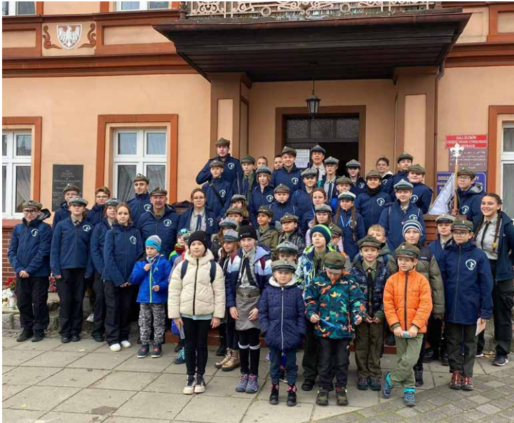
Uczestnicy gry.

11 listopada z okazji 104. rocznicy odzyskania przez Polskę niepodległości odbyła się gra miejska.