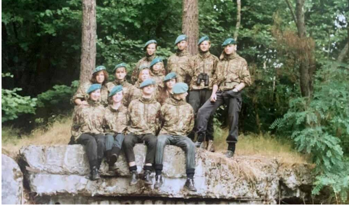
Drużyna w czasie obozu na Wale Pomorskim

W 1985 roku z inicjatywy kilku młodych harcerzy powstała 8. Skocka Drużyna Harcerska. W 1988 roku przyjęła nową nazwę Zielone Berety im. 1 Samodzielnej Kompanii Commando, na cześć oddziału polskich komandosów powstałego w czasie II wojny światowej w Anglii.