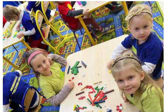
Klocki są cudownym materiałem.