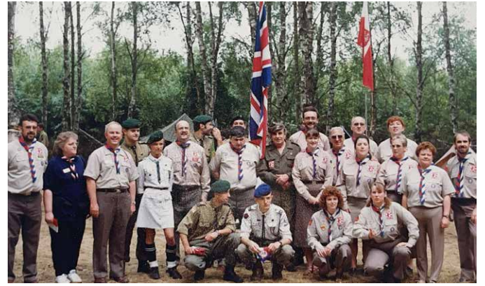
Wspólny obóz ze scoutami z Anglii na obozie w Stęszewku koło Pobiedzisk (1996)

Na co dzień były to zbiórki zastępów i drużyny, biegi patrolowe, podchody, zdobywanie sprawności i harcerskich stopni. Ważnymi wydarzeniami w życiu drużyny były rajdy, biwaki, zimowiska i letnie obozy. Te niezapomniane odbywały się w Beskidach, Karkonoszach i na Wale Pomorskim.