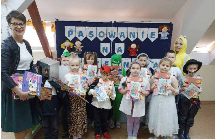
Czytelnicy na pełnych prawach.

Święto pasowania pierwszoklasistów na czytelników biblioteki odbyło się w naszej szkole 9 listopada i zostało połączone z Dniem Postaci z Bajek.