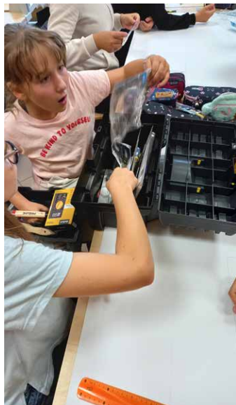
Tajemnice skrzynki narzędziowej.

Od września uczniowie naszej szkoły mogli rozpocząć zajęcia techniczne w nowo wyremontowanej, wyposażonej w sprzęty pracowni.