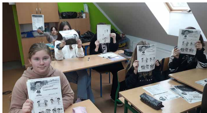
Język łaciński ułatwia naukę innych języków.

Pierwsze zajęcia z języka łacińskiego dla uczniów szkoły w Jabłkowie.