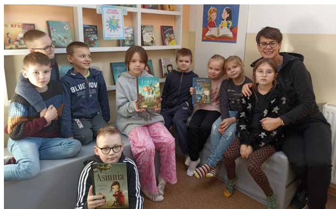
Z dziećmi trzeba rozmawiać i o wojnie, i o pokoju.

Książki z tej serii przybliżyły uczniom temat wojny w przystępny dla nich i zrozumiały sposób. Pozycje te, wielokrotnie nagradzane, cenione, wzruszające, napisane prosto, bez patosu, przybliżyły rzeczywistość zwykłych ludzi – dorosłych, ale przede wszystkim dzieci, które los rzucił w czas zawieruchy wojennej, gdyż treść wszystkich opowiadań jest oparta na autentycznych historiach osób, które w trakcie wojny były dziećmi.