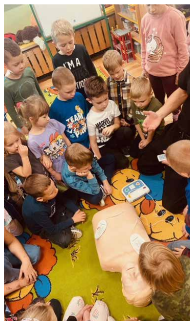
Ćwiczenia na fantomie.