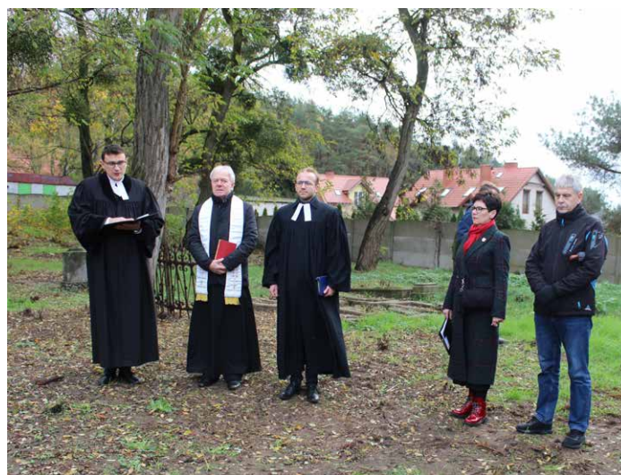
Wspólnej modlitwie przewodniczyli przedstawiciele dwóch Kościołów.

roku podjąć wspólne prace na najliczniejszym pod względem ilości grobów cmentarzu przy ul. Smolarki. Pozostałe nekropolie są mniejsze i jest tam też mniej prac do wykonania. W lutym 2022 roku odezwał się do mnie członek Stowarzyszenia Wielkopolskiej Grupy Eksploracyjno - Historycznej „Gniazdo”, zainteresowany też pracami na tym cmentarzu. Pierwsze prace wykonano 20 marca, a brali w nich udział członkowie „Gniazda” i grupy detektorystyczno - historycznej SWARÓG. Przez ten czas wielokrotnie zbierali się członkowie grupy SWARÓG i pracowali przy