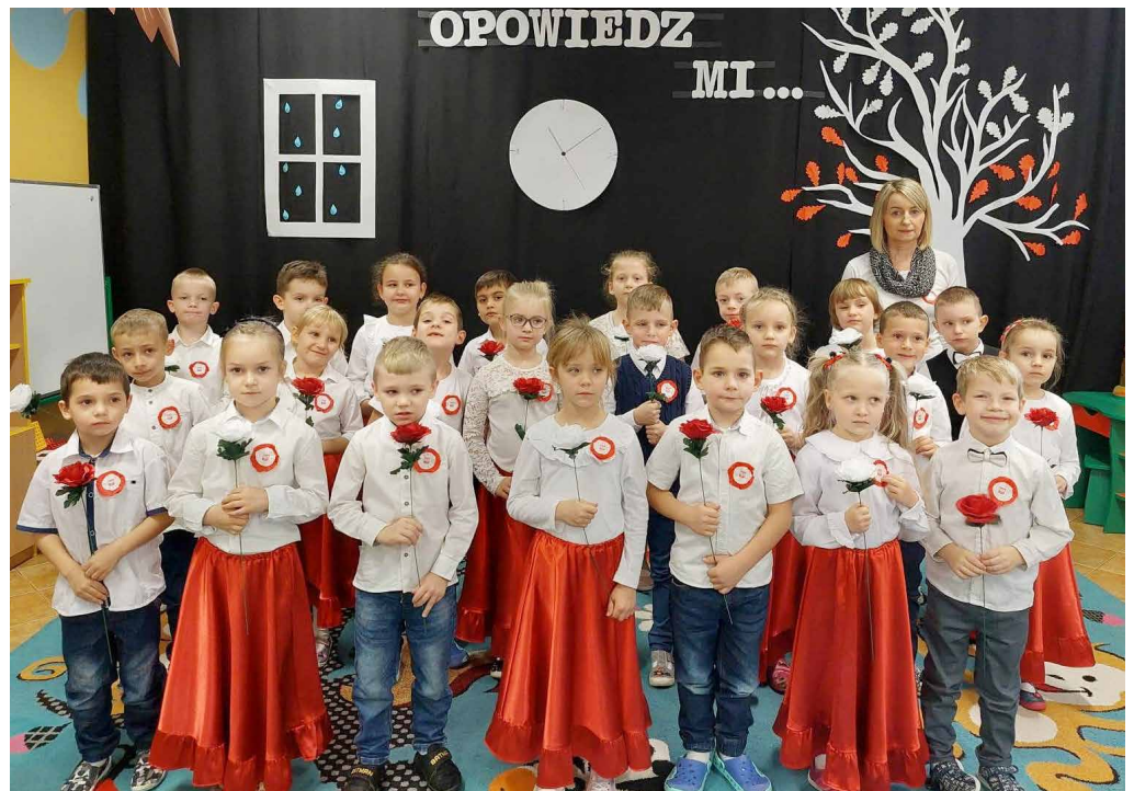
Przedszkolaki na galowo.