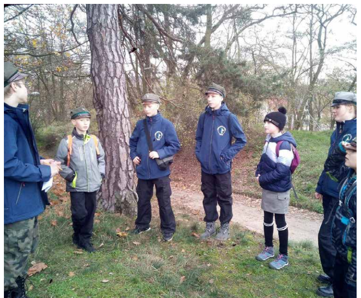
Starszy druh wyjaśnia.

W grze wzięły udział zuchy wraz z harcerzami z 7. SDH Hyce im Gen. Stanisława Sosabowskiego. Na ulice miasta wyruszyły mieszane patrole, które składały się z zuchów i harcerzy. Pomimo różnicy wieku patrole zgodnie odpowiadały na pytania i wykonywały zadania. Patrole, które zdobyły najwięcej punktów dostały drobne upominki od komendanta szczeplu. Podczas apelu kończącego grę zostały także wręczone odznaki krajoznawcze. Na koniec zawiązano krąg, po którym rozeszliśmy się do domu. (red)