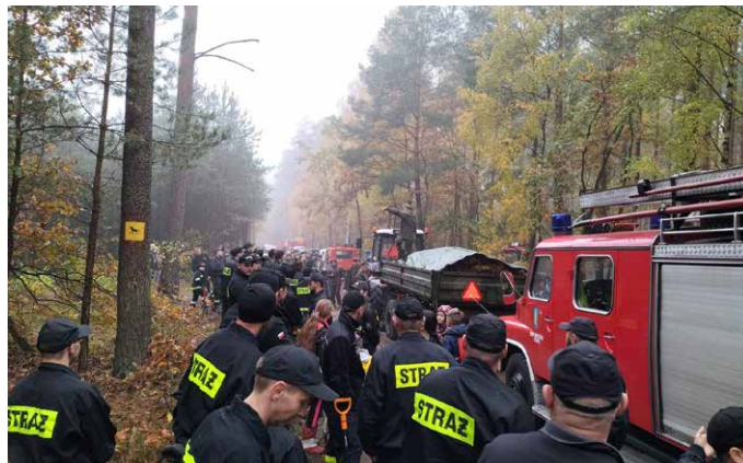
W akcji „sadziMY” brali udział strażacy z powiatu wągrowieckiego.