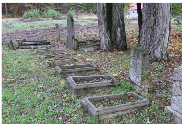
Fragment cmentarza.

Od tego czasu na terenie cmentarza pojawiają się obie grupy w różnych terminach i pracują nad kolejnymi tematami. Ostatnio odkryto dwa groby i jest ich obecnie 65, ale może być ich więcej. Prace pewnie będą trwały długo po ceremonii poświęcenia, ale otworzyła się szansa wzajemnej współpracy. Jako sołtys cieszę się, że uczestniczyłem w tym wszystkim, że udało się włączyć mieszkańców i działkowiczów w prace na cmentarzu, bo przecież pamięć o zmarłych nie umiera wraz ze śmiercią ostatniego członka rodziny. Ważne jest to, aby mimo różnego podejścia dbać o byłych mieszkańców naszej wsi, bo może za sto lub więcej lat nie będzie komu stanąć nad naszym grobem.