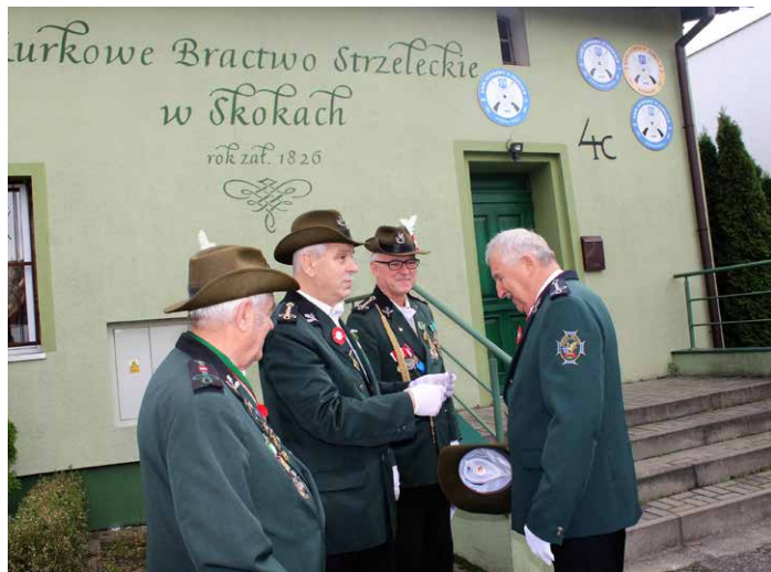
Wręczenie brackiego odznaczenia.

11 listopada, a więc w Święto Niepodległości, Kurkowe Bractwo Strzeleckie w Skokach spotkało się na uroczystym apelu.