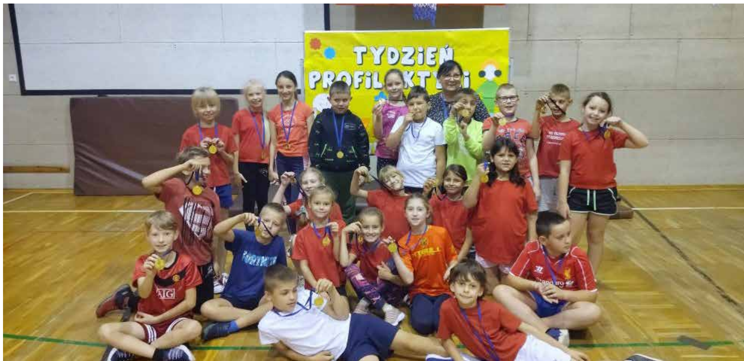
Walczyliśmy o medale.

Pod tym hasłem pod koniec września został zorganizowany Wielki Tydzień Profilaktyki, którego głównym celem było propagowanie zdrowego stylu życia, popularyzacja aktywnych sposobów spędzania wolnego czasu oraz kształtowanie nawyków dbania o zdrowie.