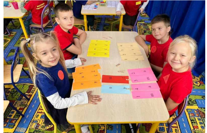
Z uśmiechem na twarzach.

Nad poprawnością wykonania zadań czuwali wychowawcy grup. Dzieci miały do wykonania 12 zadań matematycznych. Zadania, z którymi zmierzyły się dzieci, to między innymi układanie rytmów z figur geometrycznych, układanie pasków od najkrótszego do najdłuższego, wskazywanie najwyższej, najgrubszej, najmniejszej figury oraz zadanie z zakresu orientacji na kartce papieru. Ćwiczenia klasyfikacyjne z użyciem klocków; podstawy kodowania - to tylko część zadań, z jakimi mierzyli się uczestnicy I Olimpiady Matematycznej „Tęczowa matematyka” w Łosińcu.