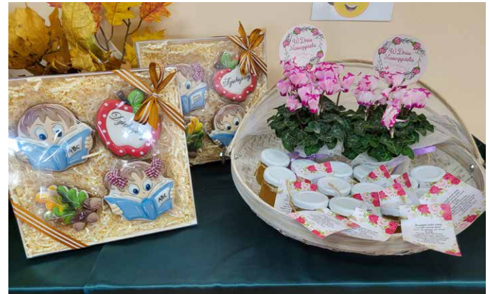
Upominki dla naszych nauczycieli.

I dlatego z tej okazji 13 października obchodziliśmy szkolne obchody Dnia Edukacji Narodowej. Uczniowie koła artystycznego i flażoletowego uświetnili ten wyjątkowy dzień w roku szkolnym. Wiele ciepłych i miłych słów popłynęło w kierunku nauczycieli i pracowników naszej szkoły. Nie zabrakło tego dnia też kwiatków i uśmiechów dla wszystkich pracowników.