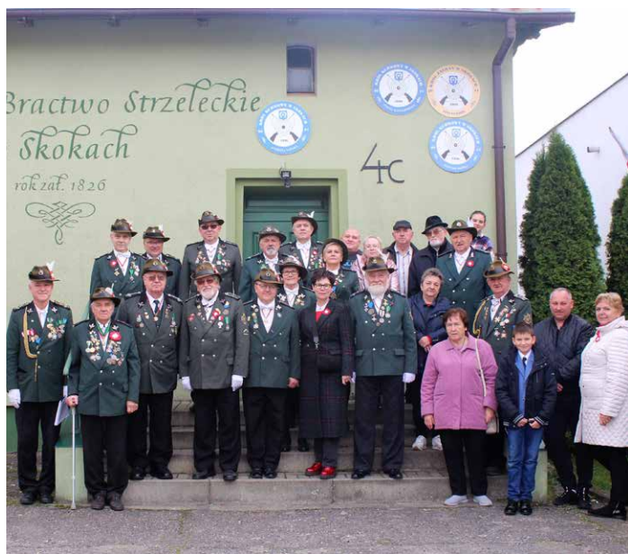
Uczestnicy apelu.

W strzelaniu o Tarczę Darczyńców zwyciężył Andrzej Tatar przed Jarosławem Adamskim i Alojzym Pacholskim .