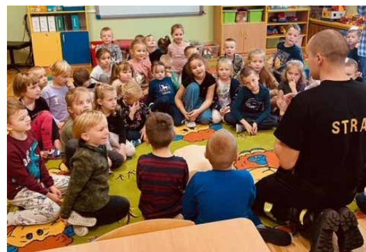
Tyle ciekawych rzeczy usłyszeliśmy.