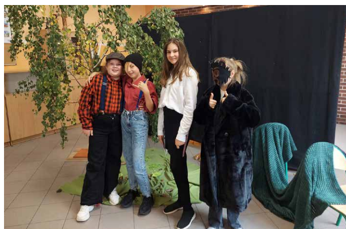
W pełni zadowoleni.

Z przyjemnością poświęcałam kolejne lekcje języka polskiego na twórczość teatralną moich uczniów, ponieważ wiem, że gra aktorska stymuluje ich do odwagi oraz staje się motywacją do nowych wyzwań. Daje też poczucie wartości i nadaje sens twórczej aktywności zarówno dziecka, jak i nauczyciela.