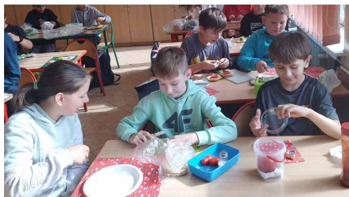
Aby zdrowo jeść.

Pod tym hasłem pod koniec września został zorganizowany Wielki Tydzień Profilaktyki , którego głównym celem było propagowanie zdrowego stylu życia, popularyzacja aktywnych sposobów spędzania wolnego czasu oraz kształtowanie nawyków dbania o zdrowie .