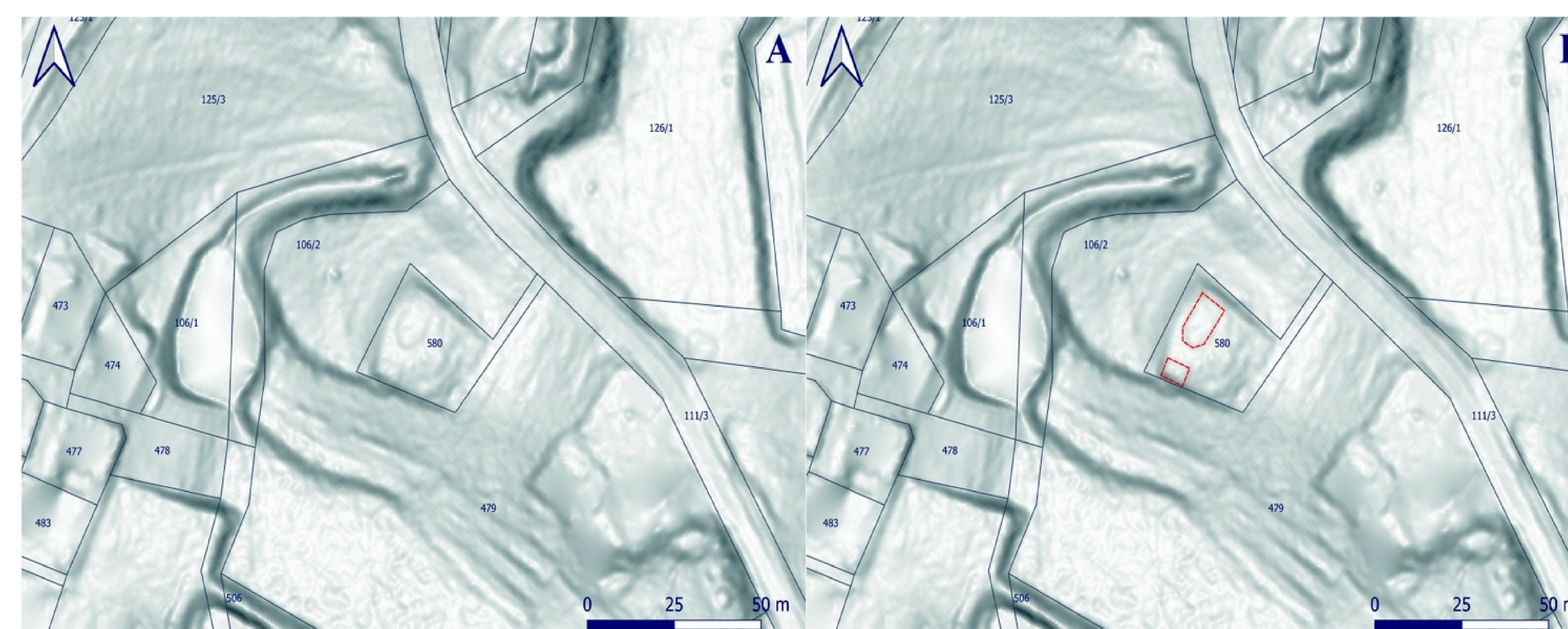
Cieniowany model terenu z widocznymi śladami po kościele braci czeskich i grobowcu (oprac. M. Krzepakowski, P. Wroniecki)