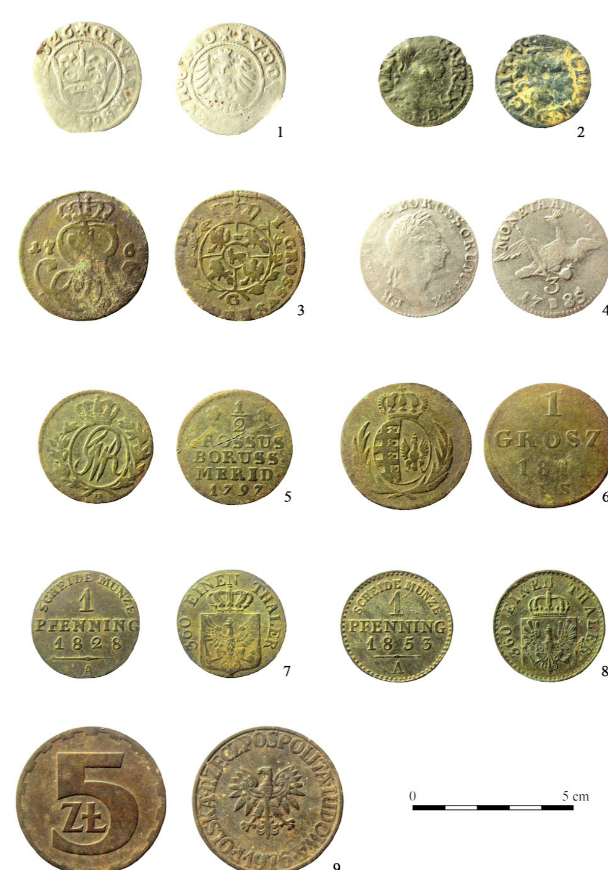
Monety odkryte podczas prac archeologicznych