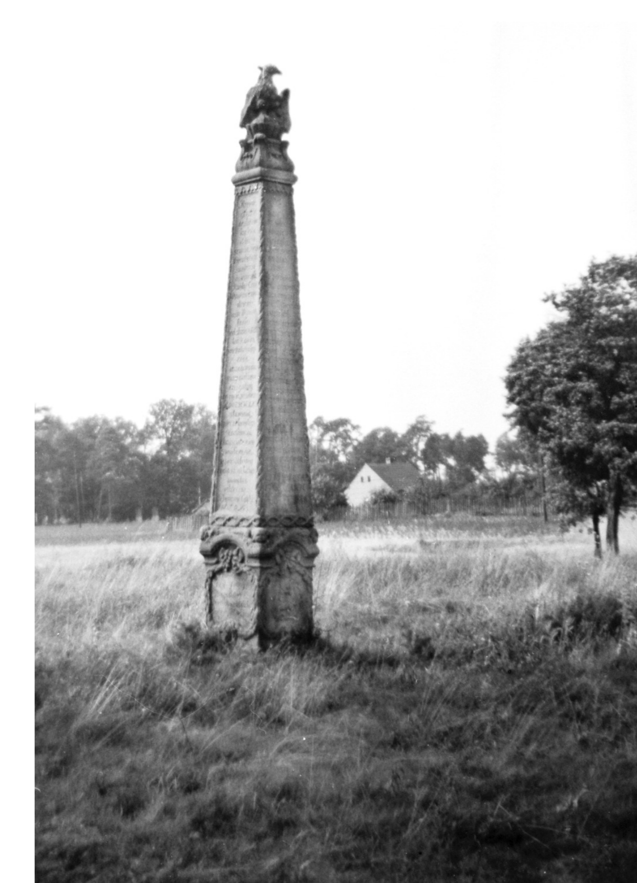
Nagrobek Heleny Bogumily z Mielęckich Karczewskiej (zm. 1787) sfotografowany przez Stanisława Pijanowskiego w latach 50. XX wieku na terenie cmentarza braci czeskich w Skokach. (prywatne archiwum cyfrowe M. Krzepakowskiego)