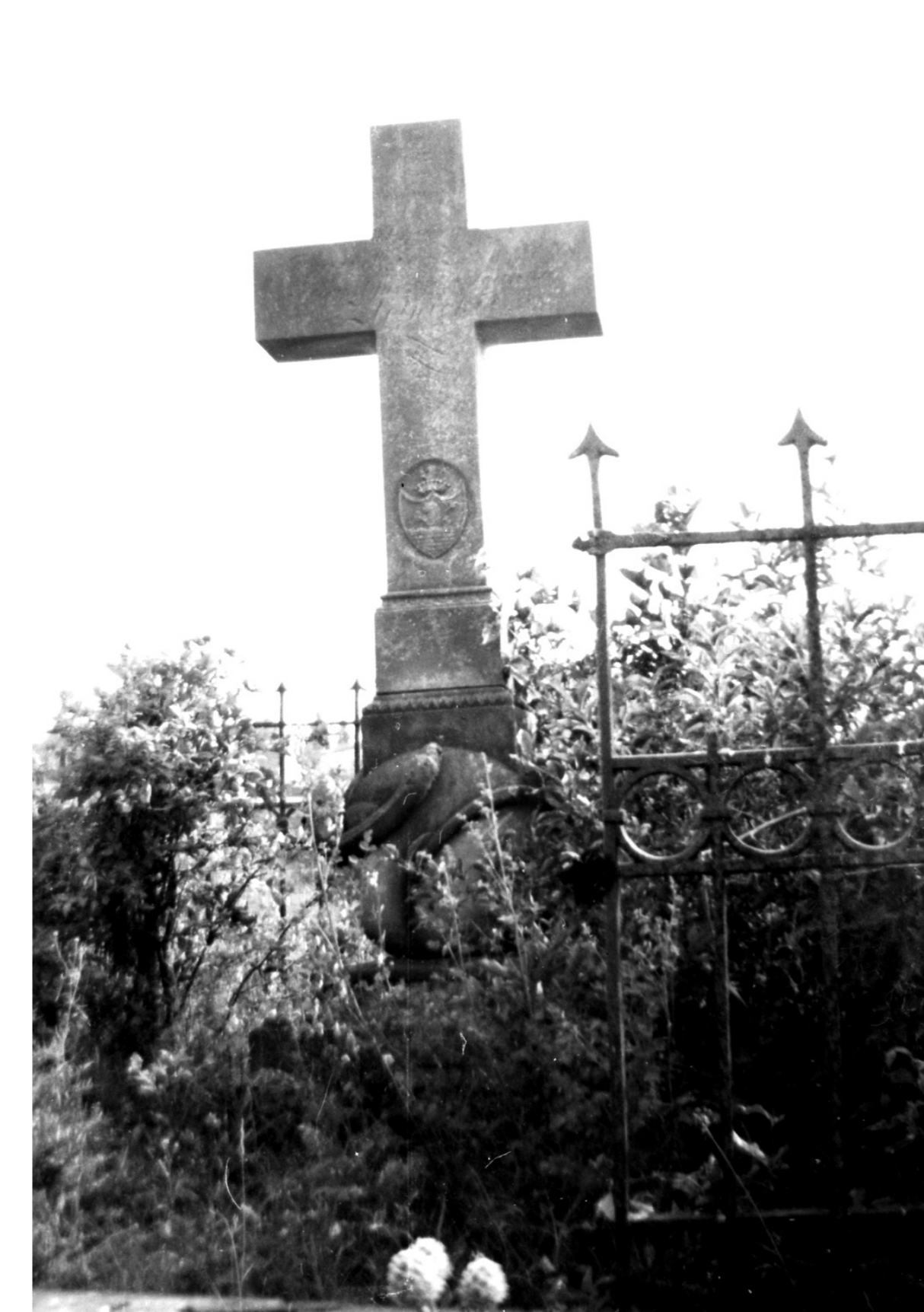
Nagrobek Jerzego (zm. 1831) i Bogumily Złotnickich sfotografowany przez Stanisława Pijanowskiego w latach 50. XX wieku na terenie cmentarza braci czeskich w Skokach. (prywatne archiwum cyfrowe M. Krzepakowskiego)