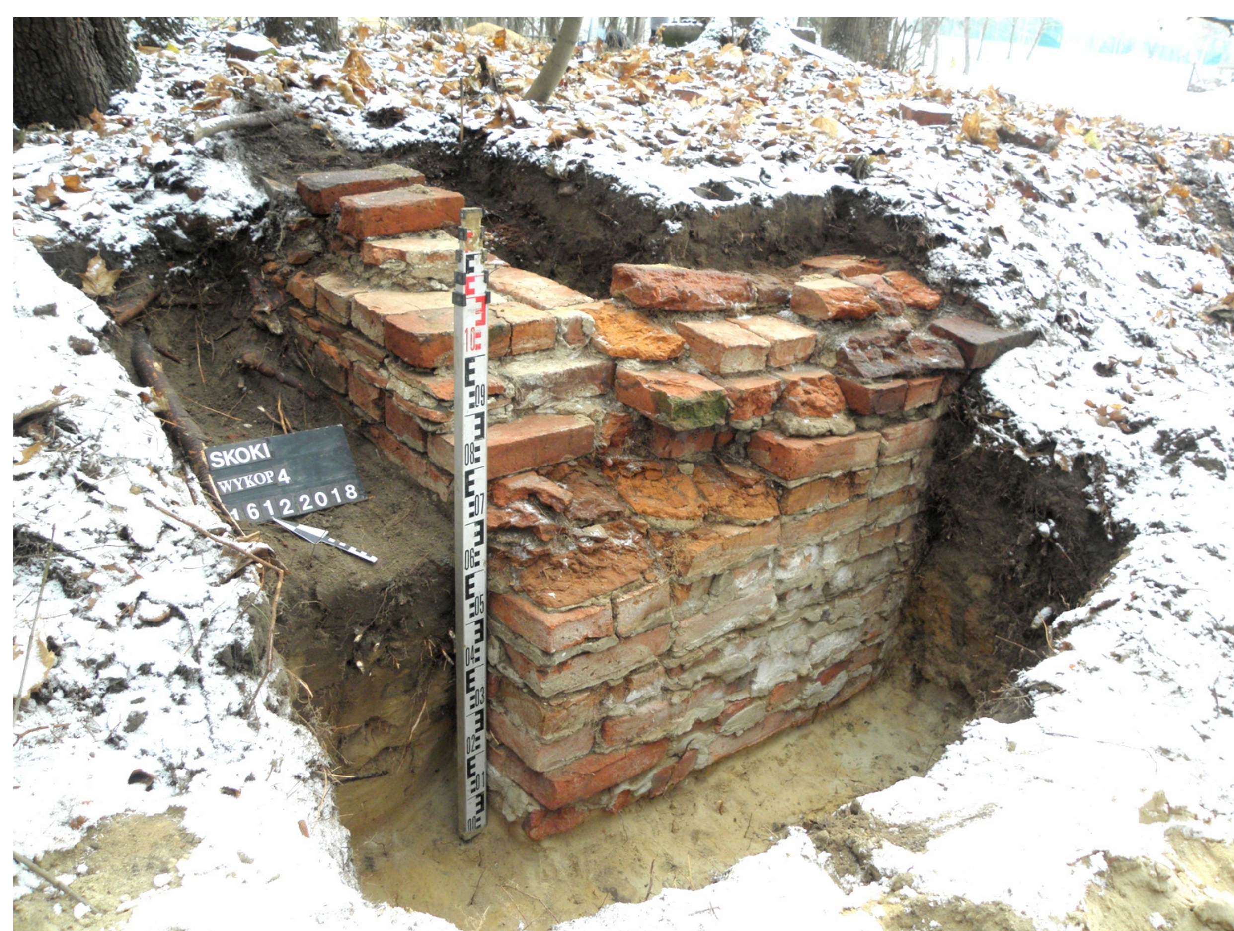
Odsłonięty fragment grobowca rodziny Złotnickich