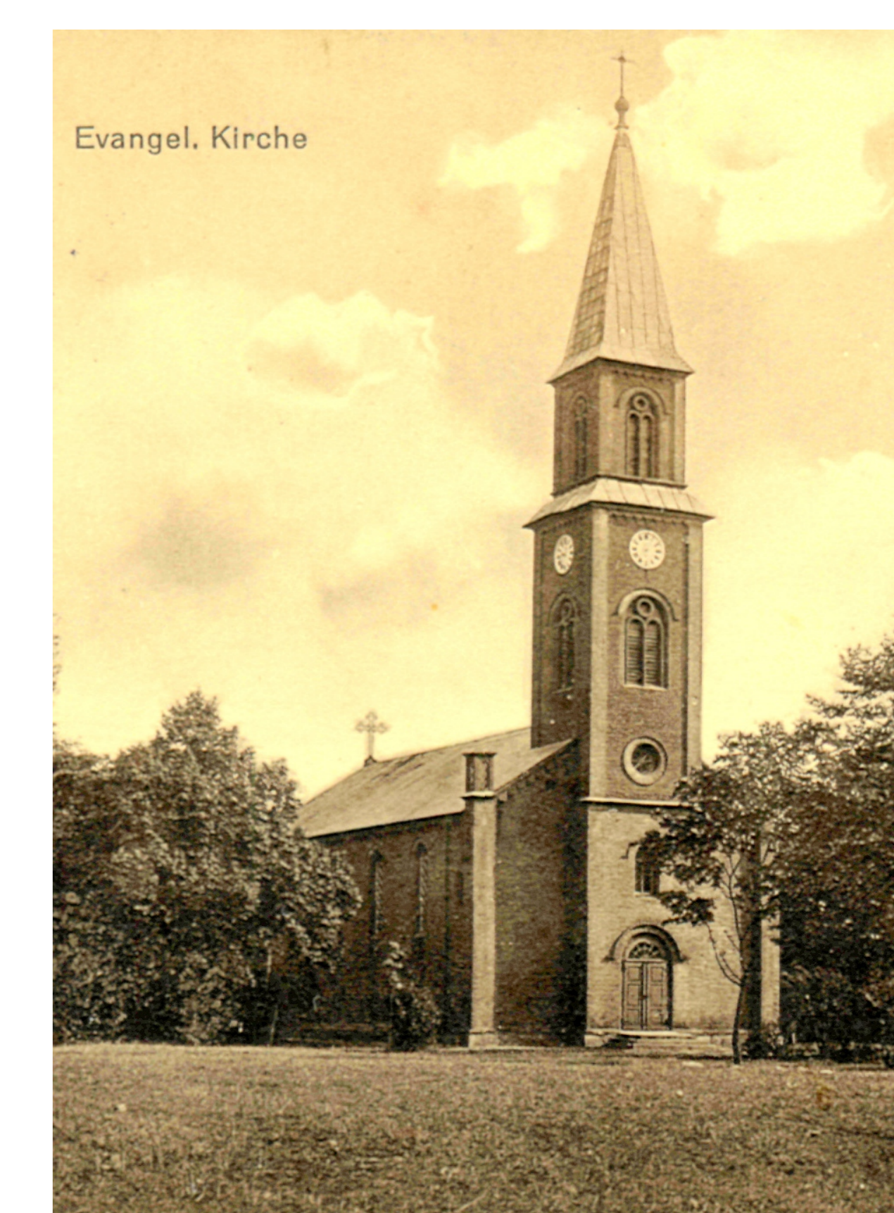
Kościół z 1856 wybudowany na pobliskim wzniesieniu dla skockiej wspólnoty luterńskiej. Od 1945 pełni rolę katolickiego kościoła pomocniczego pw. św. Piotra i Pawła (widokówka z kolekcji I. Migasiewicz)