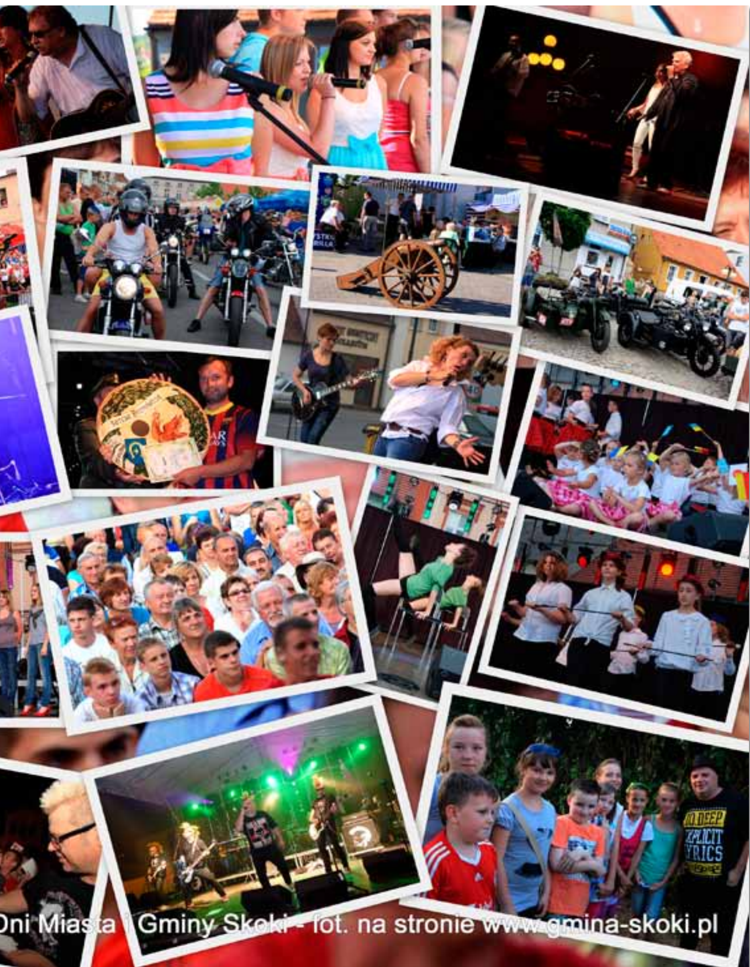
Dni Miasta Gminy Skoki