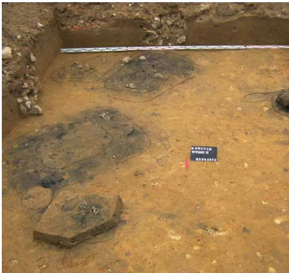
Jedno z doskonale zachowanych palenisk kowalskich

Wznowione w początku sierpnia prace wykopaliskowe pozwolą rozpoznać dalszą część pracowni metalurgicznej. Prowadzone aktualnie badania archeologiczne to zaledwie początek przygody wągrowieckich archeologów z kakulińskimi dymarkami. Po zakończeniu prac terenowych czeka ich żmudne opracowywanie wyników badań. Konieczne jest również wykonanie szeregu kosztownych analiz specjalistycznych w tym także metaloznawczych odkrytych żużli. Planowane są też badania geomagnetyczne najbliższego