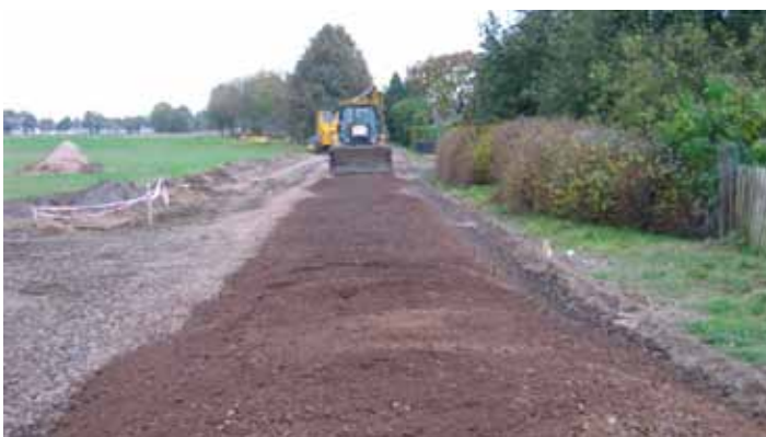
Budowa drogi w Roszkówku.