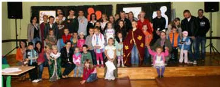
Popołudnie z Korczakiem