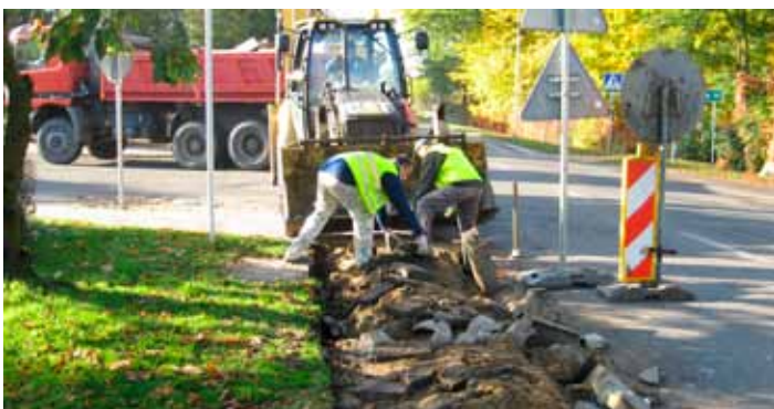
Budowa chodnika wzdłuż ul. Wągrowieckiej.