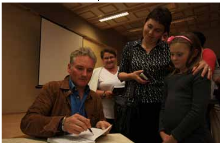
Świat według Kreta.