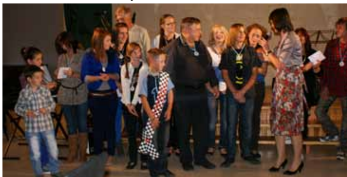
Skockie Śpiewanki Rodzinne