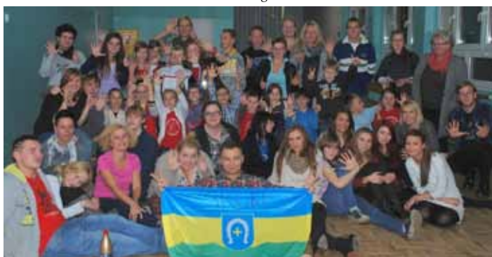
Wizyta u Libera.