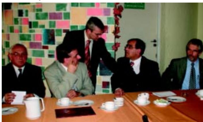
Uczestnicy spotkania w Bliźnych poznali działania i osiągnięcia Fundacji w zakresie opieki i wychowania dzieci.