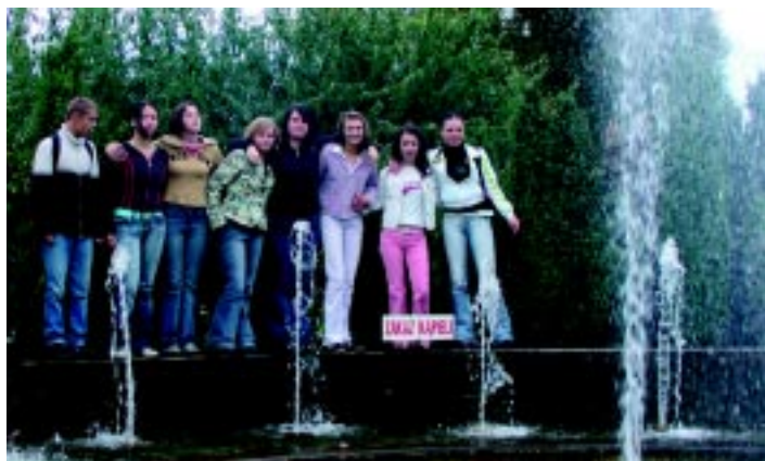
Młodzież z Ośrodka w Antoniewie zwiedzała miasto Staszica.