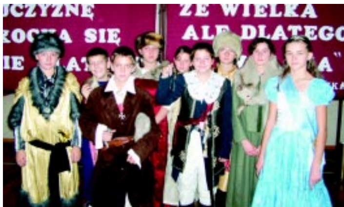
Skoczanie uczcili Dzień Niepodległości: w szkołach odbyły się uroczyste Akademie i Apele...