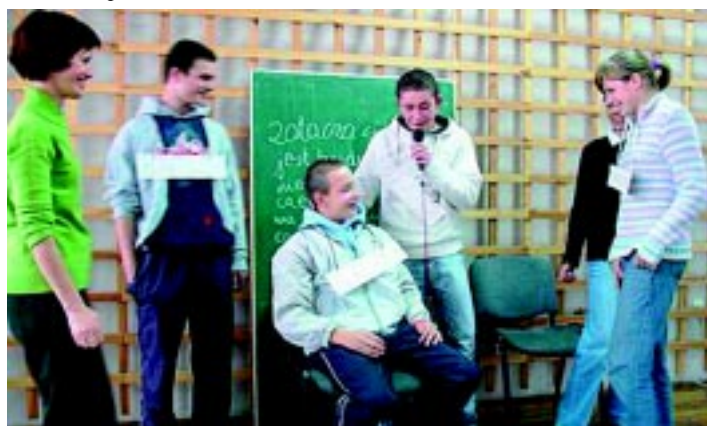
Młodzież uczestniczyła w warsztatach o problematyce antyalkoholowej.