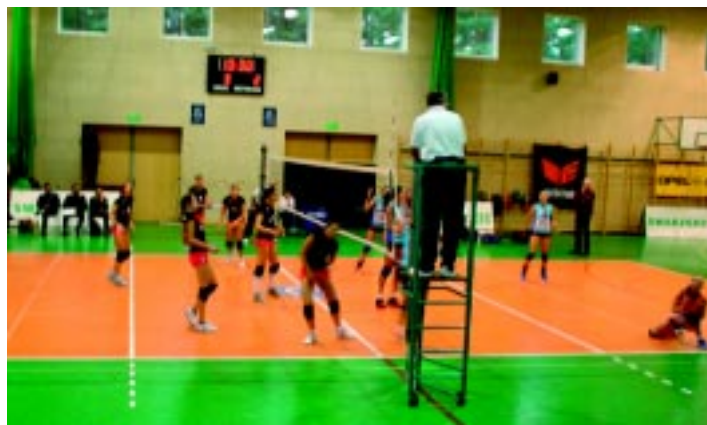
Czołowe Kluby Polskiej Ligi Siatkówki uczestniczyły w Turnieju w hali Gimnazjum.