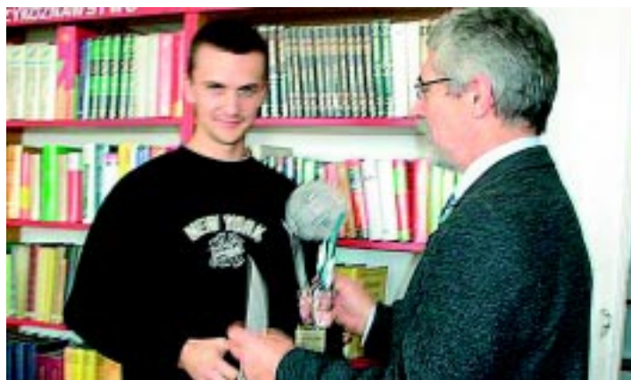
Reprezentacja Potrzebanowa zdobyła Kryształowy Puchar - nagrodę Burmistrza w Wiejskiej Lidze Piłki Nożnej.