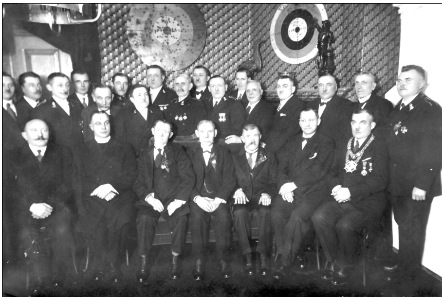
Kurkowe Bractwo Strzeleckie w Skokach – 12.02.1936.