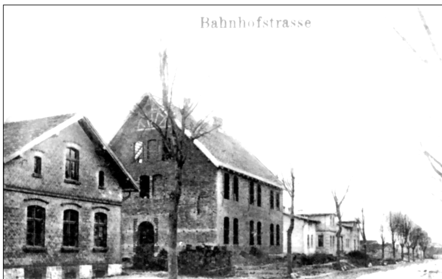
Skoki, ul. Dworcowa (dziś: Wągrowiecka) - na pocztówce z 1912 r. widoczne budynki usytuowane naprzeciwko parku. (kolekcja IM)