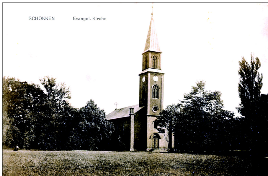
Neogotycki kościół ewangelicki wybudowany w latach 1855-1856 dla skockiej wspólnoty luterańskiej na wzniesieniu przy dzisiejszej ulicy Parkowej. Od 1945 r. pełni rolę katolickiego kościoła pomocniczego pw. św. Piotra i Pawła.