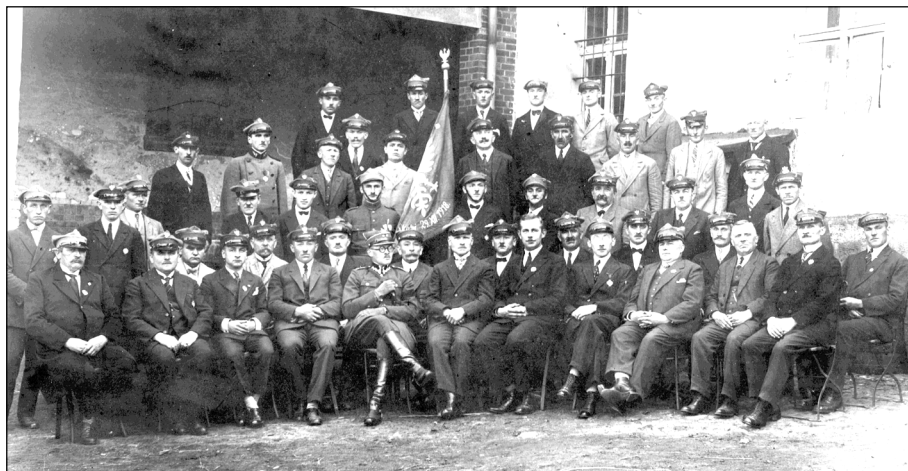
Towarzystwo Wojaków i Powstańców w Skokach – 1929 r.