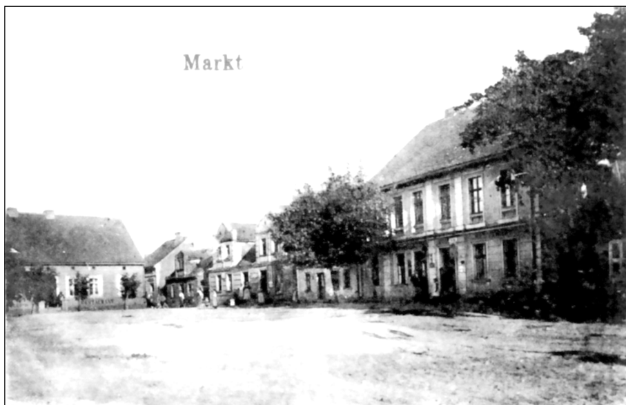
Skoki, Rynek (dziś: pl. Powstańców Wielkopolskich). Międzywojenny widok południowo-wschodniej strony placu.