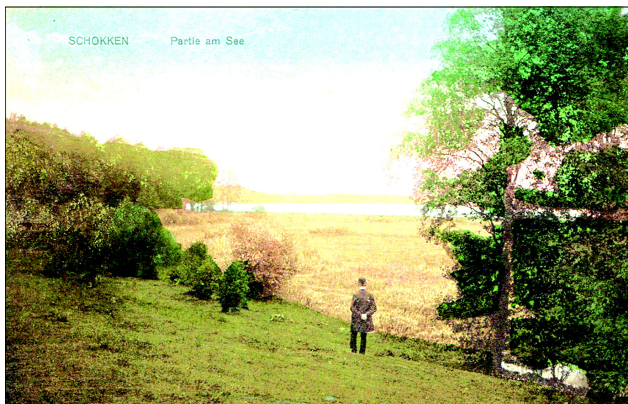
Na widokówce wysłanej ze Skoków w 1912 r. Jezioro Rościńskie.