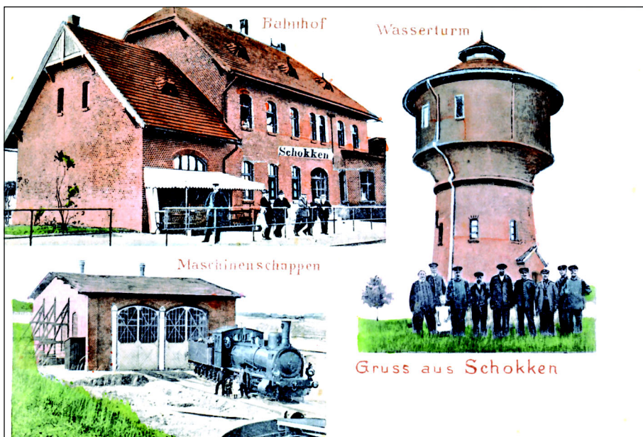
Dworzec kolejowy w Skokach oraz wieża ciśnieni i nieistniejąca już maszynownia. Widokówka z roku 1908.