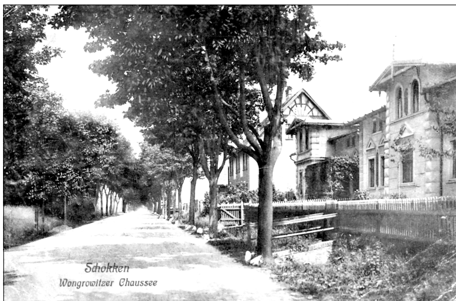
Wille przy ulicy Wągrowieckiej zbudowane na początku XX wieku.