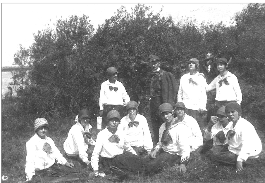
Stowarzyszenie Młodych Polek w Skokach. Zdjęcie z ok. 1920.