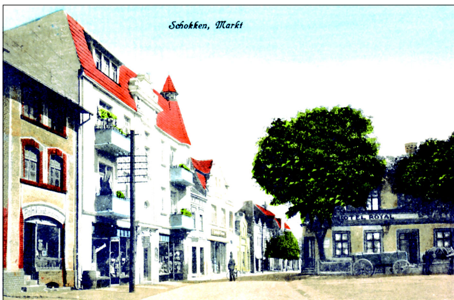
Skoki, Rynek (dziś- pl. Powstańców Wielkopolskich). Na pocztówce z początku XX wieku północno-wschodnia pierzeja.