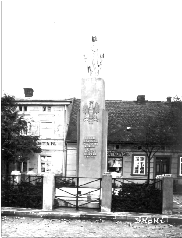
Pomnik Najświętszego Serca Jezusowego ufundowany przez mieszkańców Skoków w 1935 r., który został ogłoszony Rokiem Jubileuszu Odkupienia Świata. Na cokole umieszczono godło państwowe oraz inskrypcję: „Boskiemu Sercu Jezusa za odzyskanie wolności w 1900 rocznicę odkupienia świata”. Do 1939 r. stał na wschodniej pierzei skockiego Rynku (dziś: pl. Powstańców Wielkopolskich).