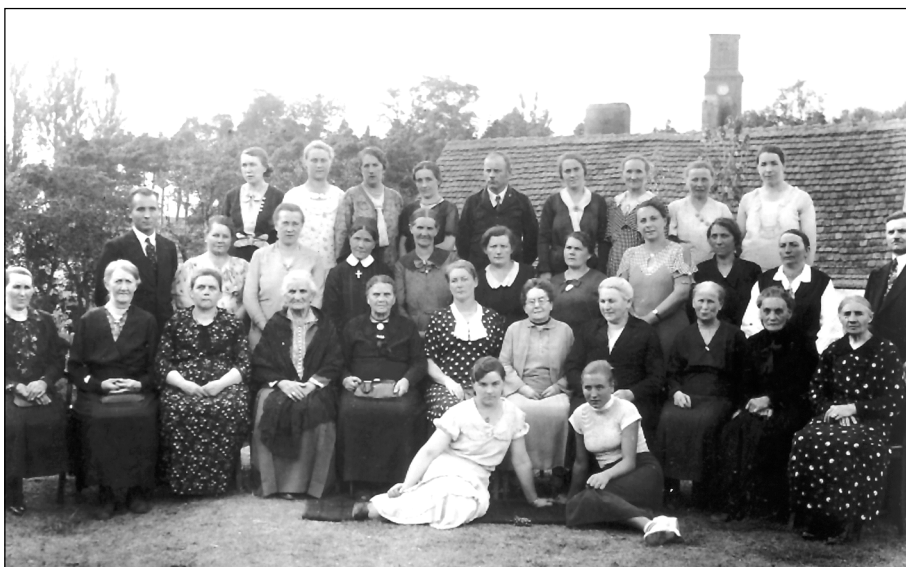
Przedstawicielki wspólnoty luterańskiej w Skokach.