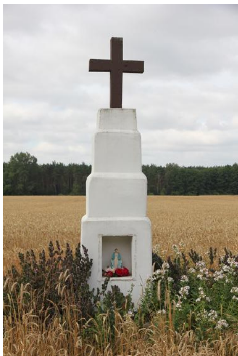
17. Dodatkowe materiały kartograficzne i fotografie