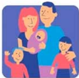
KARTA DUŻEJ RODZINY