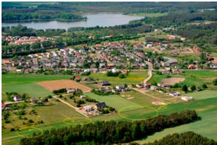
Skoki, ul. Kościuszki

Najdroższe w tej chwili są działki w Skokach w rejonie ul. T.Kościuszki i Antoniewskiej. Do kupienia pozostało tam dwanaście działek idealnych na budowę nowoczesnych domów energooszczędnych. Powierzchnia nieruchomości waha się od 600 m 2 do 700 m 2 a cena 1m 2 wynosi 55 zł brutto.