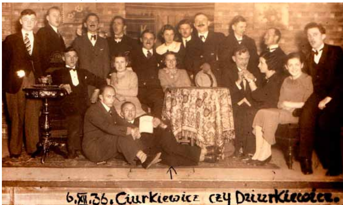
6.XII.36. Ciurkiewicz czy Dziurkiewicz.

Z nich dowiadujemy się, że w czasach gdy nie było telewizji, Internetu oraz organizującej życie kulturalne Biblioteki lub Domu Kultury, a posiadanie telefonu, radia, czy nawet roweru było luksusem, znajdowali się ludzie, którym nieobce było życie kulturalne.