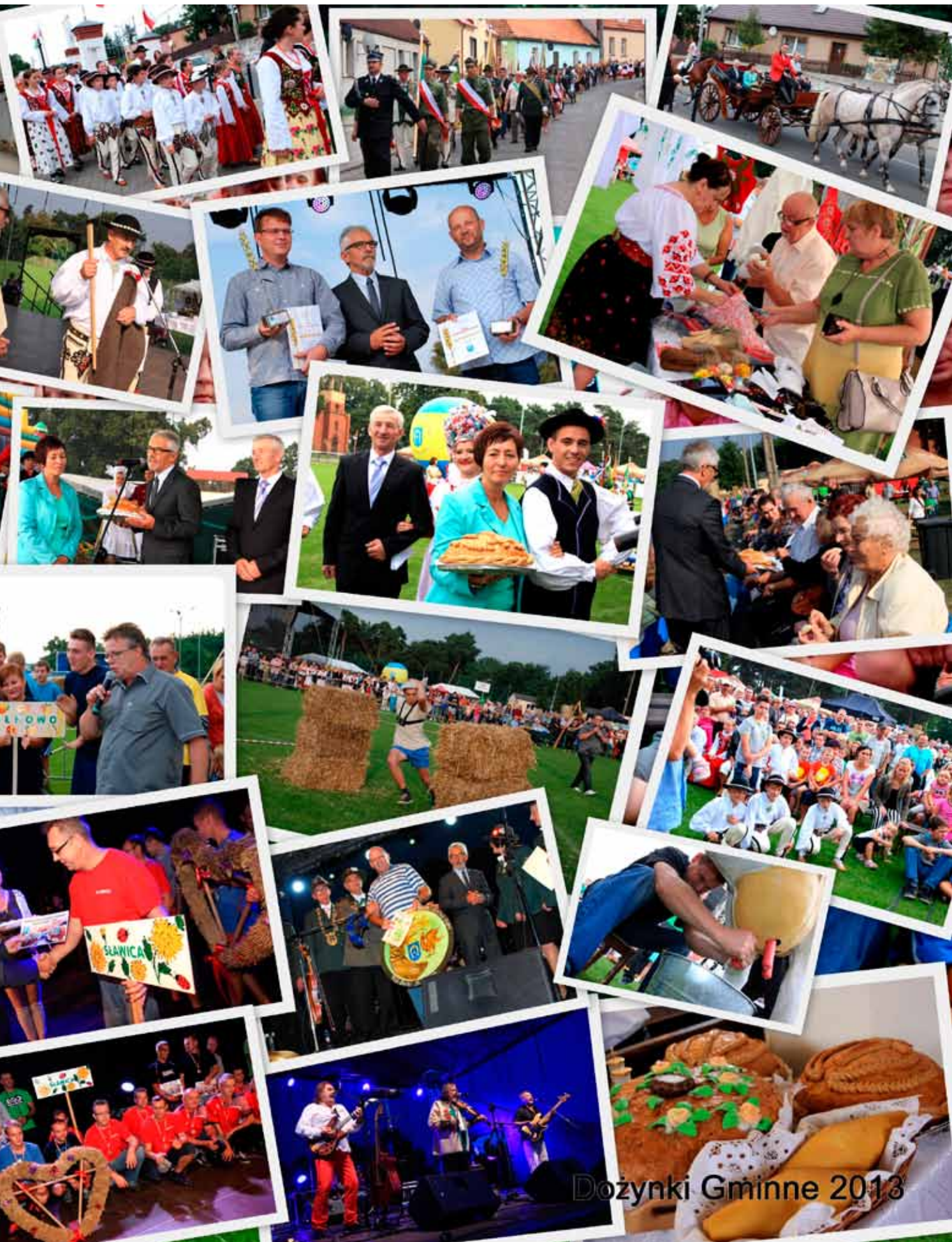
Dożynki Gminne 2013