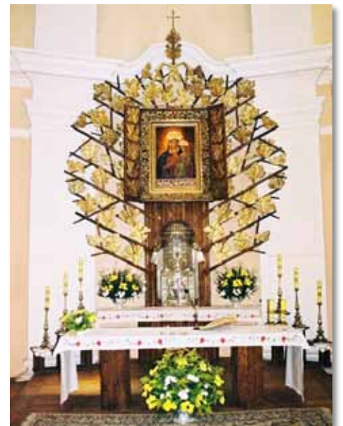
Ołtarz główny z cudownym obrazem.