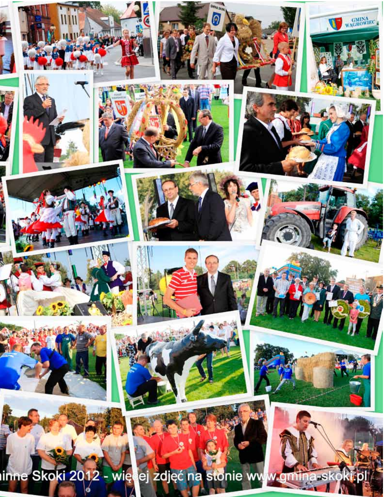
inne Skoki 2012 - więcej zdjęć na stronie www.gmina-skoki.pl