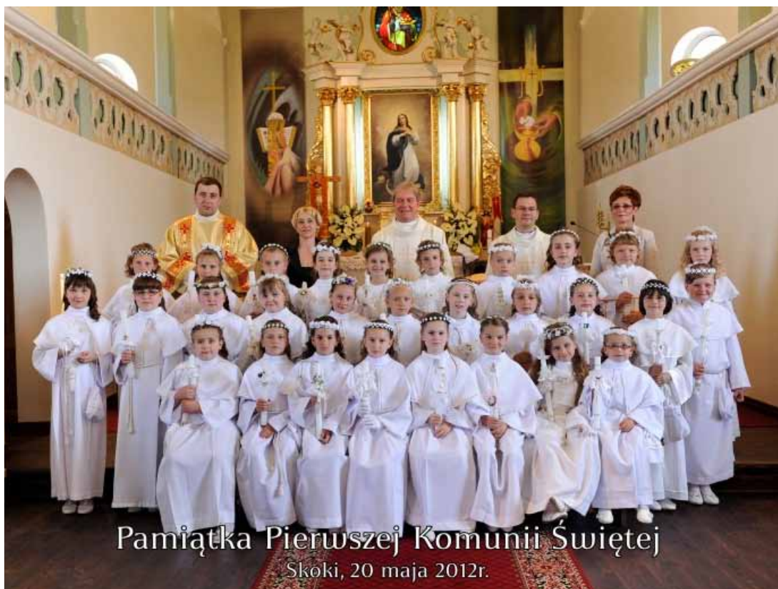
Pamiętka Pierwszej Komunii Świętej Skoki, 20 maja 2012r.