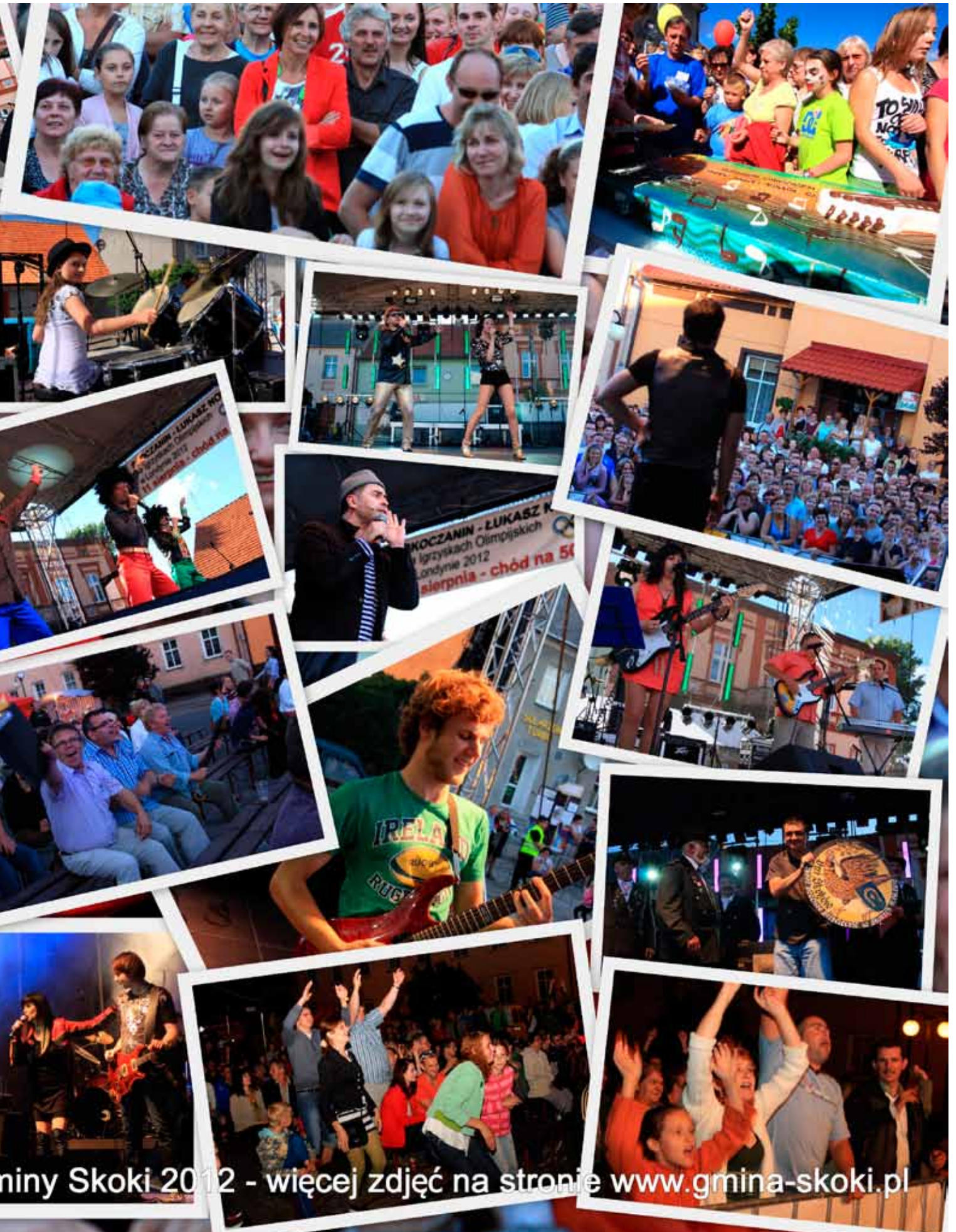
miny Skoki 2012 - więcej zdjęć na stronie www.gmina-skoki.pl