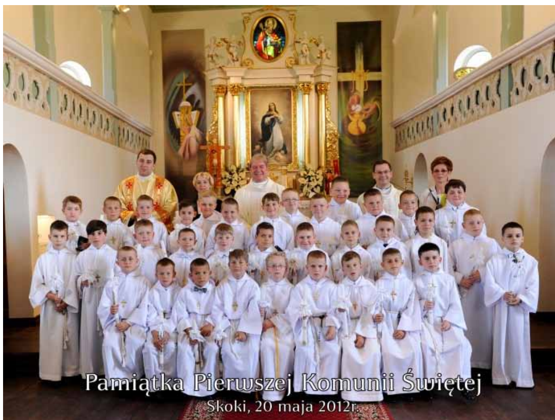
Pamiętka Pierwszej Komunii Świętej Skoki, 20 maja 2012r.