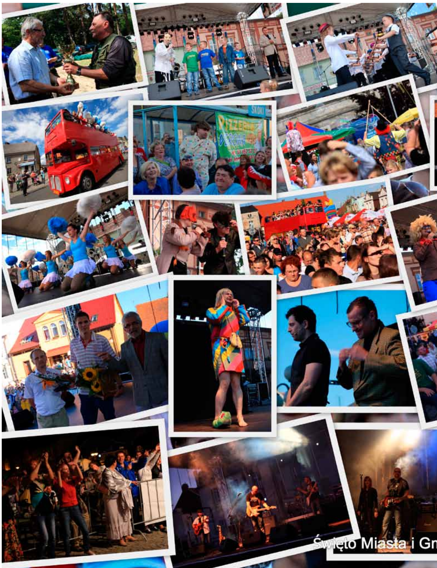
Święto Miasta i Gminy