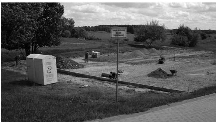
Budowa targowiska w Skokach.

sowanie ze środków UE w wys. 1.000.000 zł.