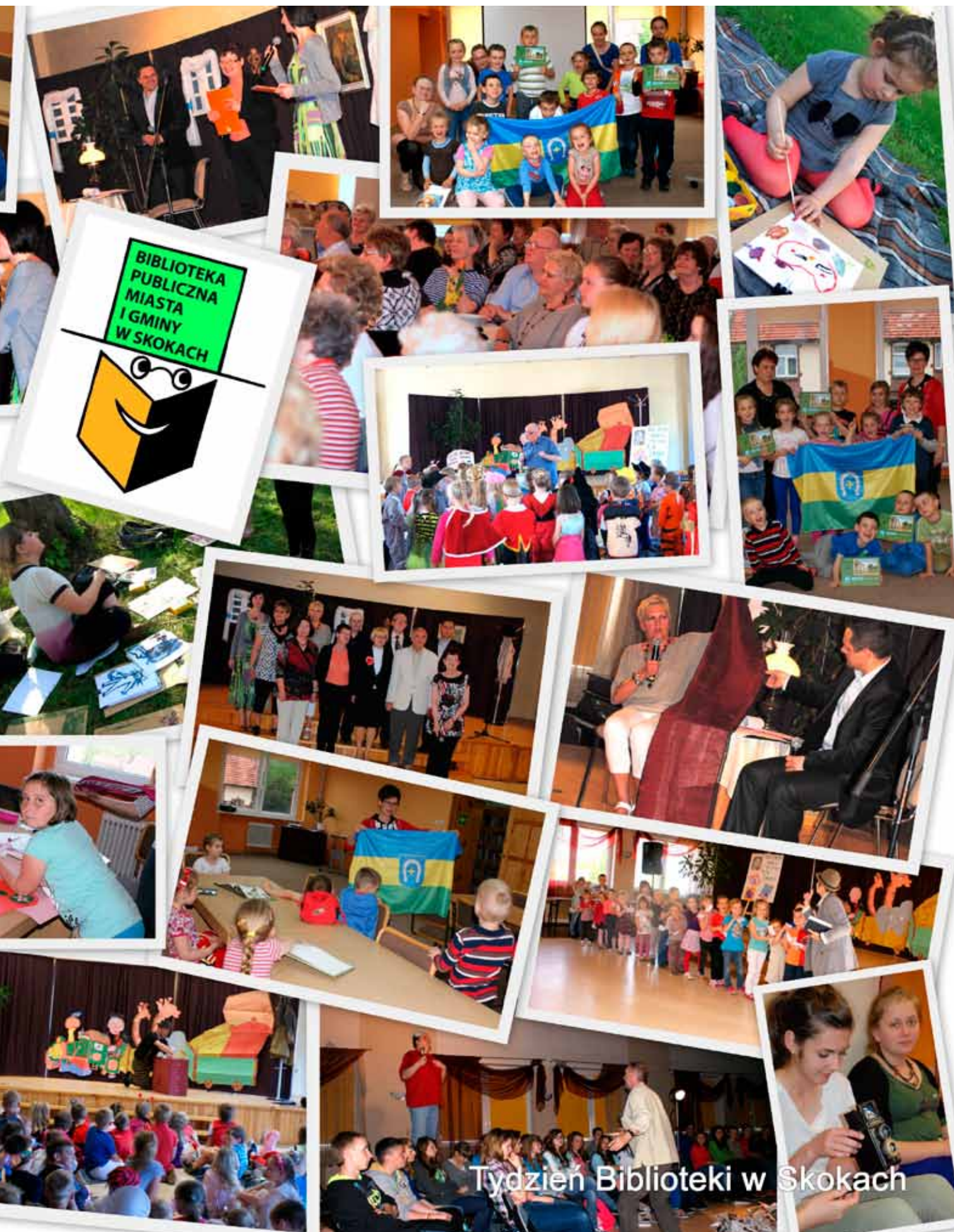
Tydzień Biblioteki w Skockach