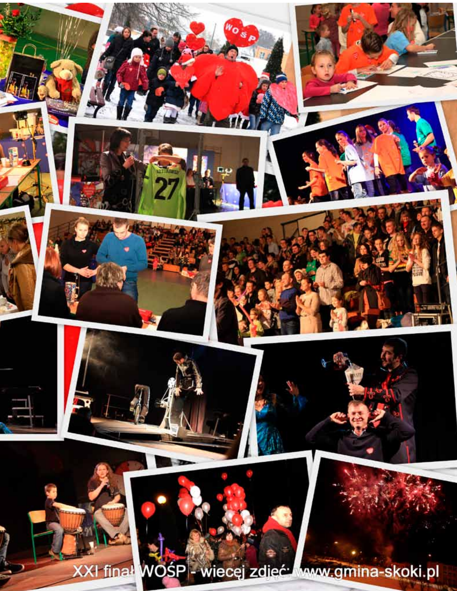
XXI finał WOŚP - więcej zdjęć: www.gmina-skoki.pl