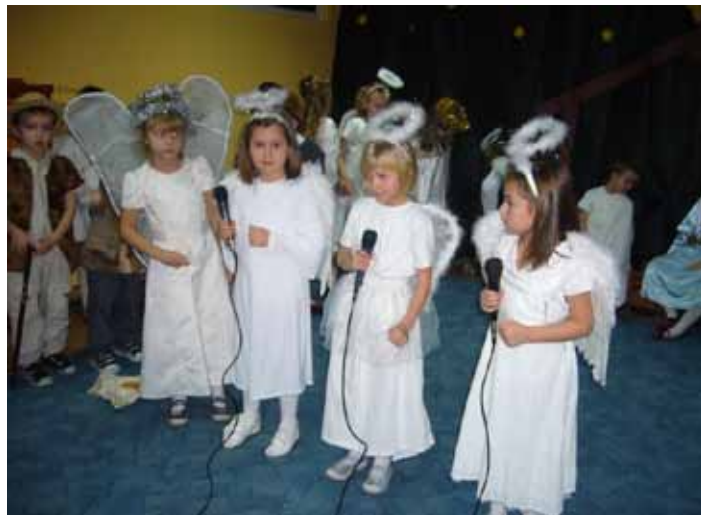
Jasełka w Przedszkolu Samorządowym w Skokach.