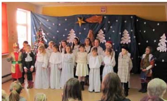
Jasełka w Szkole Podstawowej w Jabłkowie.