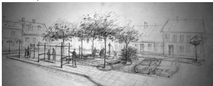
Koncepcja zagospodarowania placu

Inwestycja, zgodnie z konsultowanym z mieszkańcami projektem, polegać będzie na wymianie nawierzchni centralnej części placu „przy pompie”, adaptacji terenu wokół pompy na miejsce wypoczynku (wykonanie rzeźb z brązu, montaż ławek, renowacja i montaż pompy). Koszt całego przedsięwzięcia wyceniony został na 300.000 zł, z tego 80% kosztów kwalifikowanych otrzymamy z Programu Rozwoju Obszarów Wiejskich.