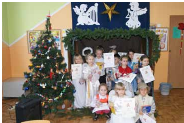
Kolędowanie Przedszkolaków w Przedszkolu Publicznym w Jabłkowie.