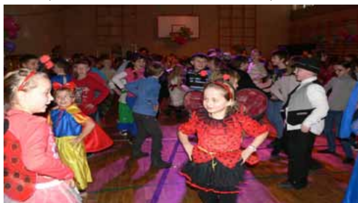
Zabawa karnawałowa w Szkole Podstawowej w Skokach.