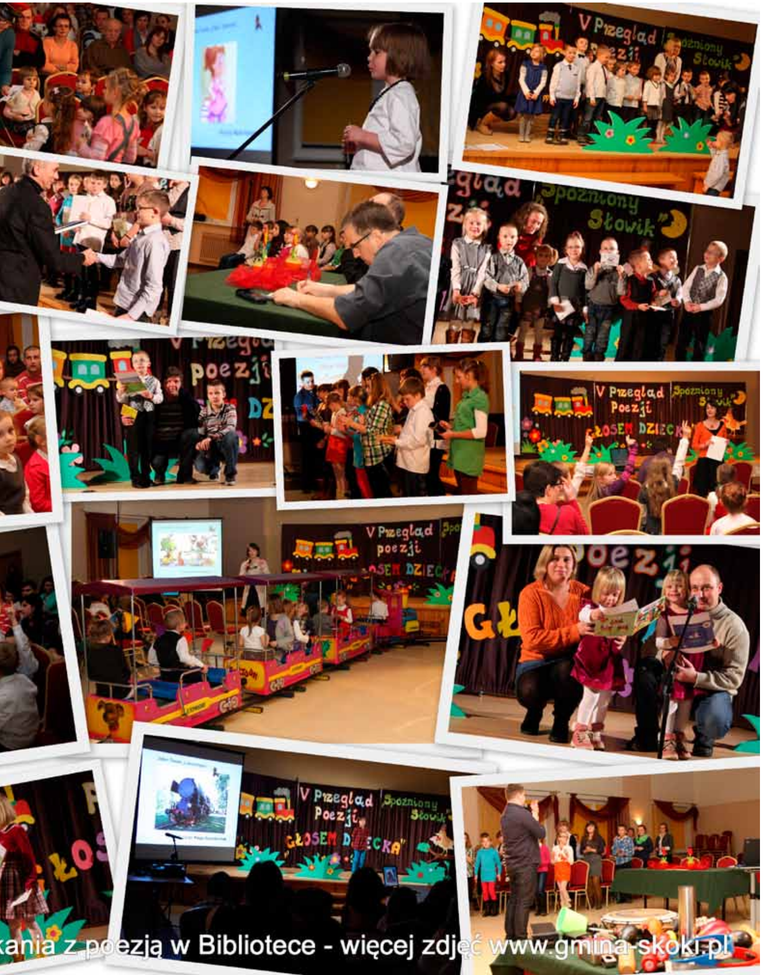
Wystąpienia z poezją w Bibliotece - więcej zdjęć www.gmina-skoki.pl