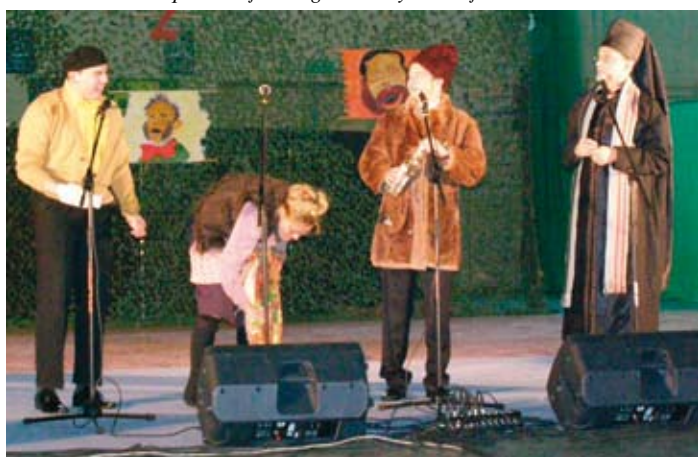
Krakowski kabaret Pod Wyrwigroszem w skockiej hali.