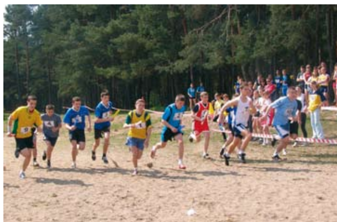
Start sztafety podczas obchodów święta skockiego Gimnazjum.