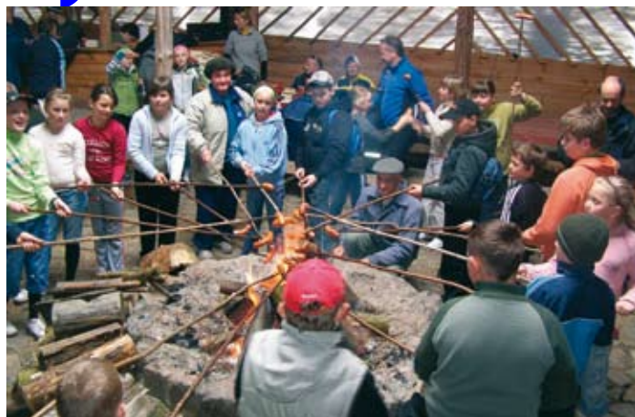
Kielbaski na mecie rajdu rowerowego w Pawlowie Skockim.