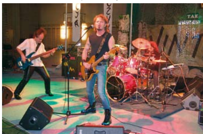
Koncert rockowego trio VINTAGE w hali gimnazjum.