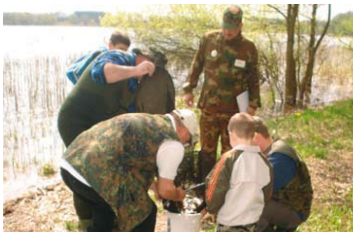
Splawikowe Zawody Wędkarskie nad jeziorem Rościńskim.