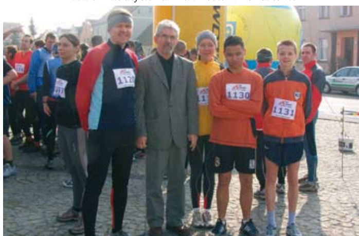
Skocka reprezentacja w biegu terenowym w Rajdzie WERTOPY.