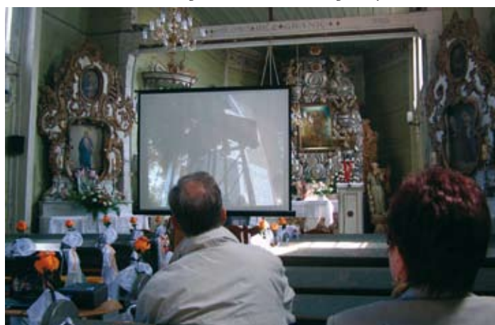
Prelekcja filmu o kościołach drewnianych w kościele w Jabłkowie.