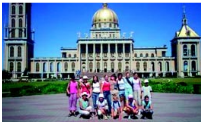
Uczestnicy półkolonii przed licheńską bazyliką.