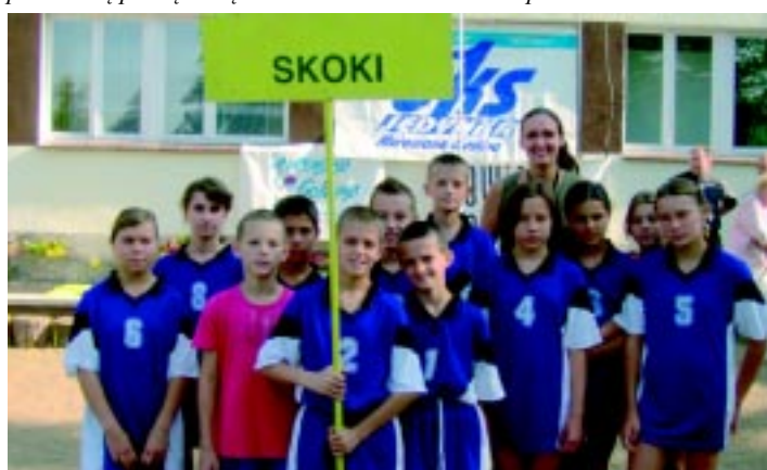
Reprezentacja Szkoły Podstawowej w Skokach brała udział w III Biegu Przelajowym o Puchar Związku Międzygminnego „Puszcza Zielonka”.