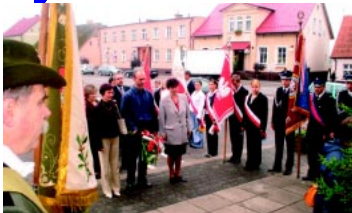
1 września br. przedstawiciele mieszkańców Miasta i Gminy Skoki zebrali się pod tablicą pamiątkową na Placu Powstańców Wielkopolskich.