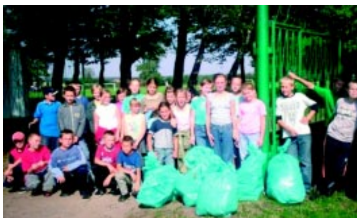
Dzieci ze szkoły w Jabłkowie uczestniczący w akcji „Sprzątanie świata”.