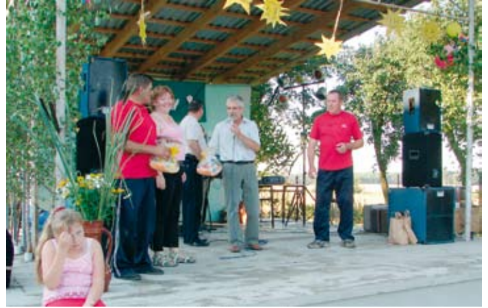
Słoneczny festyn w Potrzeznowie.