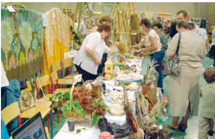
Koło Gospodyń Wiejskich z Potrzeznowa na Gali Produktów Regionalnych.