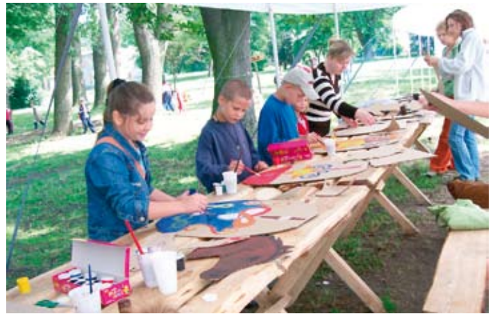
Półkolonie Szkół Fundacji.