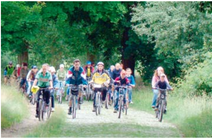
Uczestnicy rajdu do Dąbrówki Kościelnej.