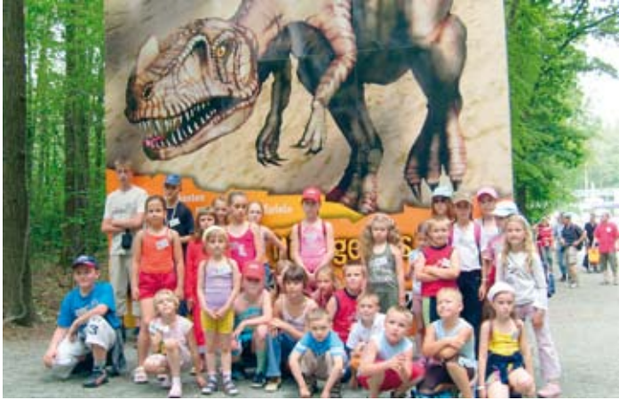
Uczestnicy wyjazdu do Kleinwelke.