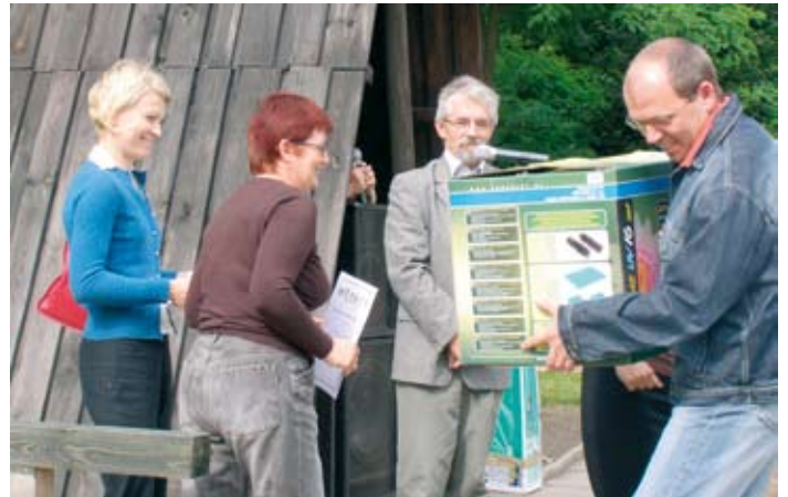
Finał Konkursu Piękna i Zielona Gmina 2007.