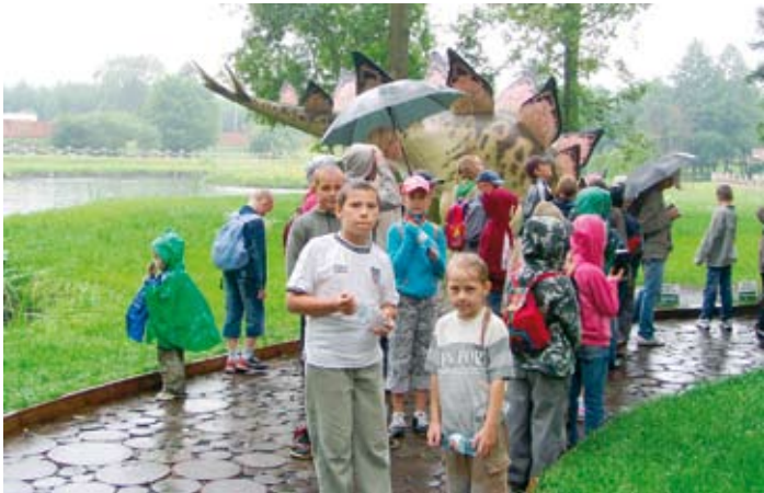
Pogoda nie była przeszkodą dla uczestników letnich imprez przy Szkole Podstawowej.