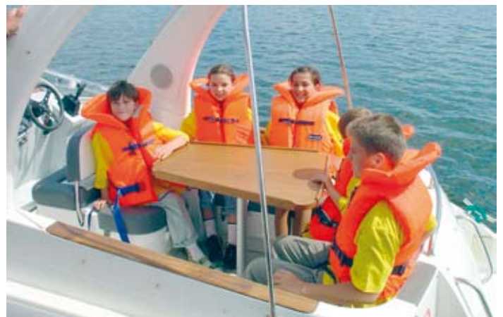
Żagle dla wszystkich.