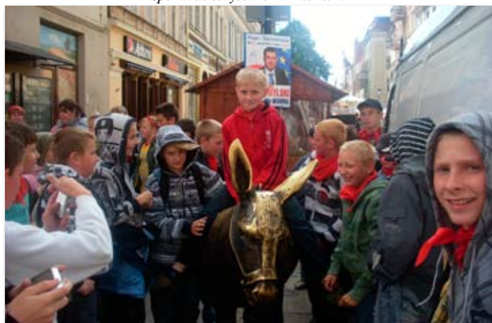
Uczniowie z Pawłowa Skockiego w Toruniu.