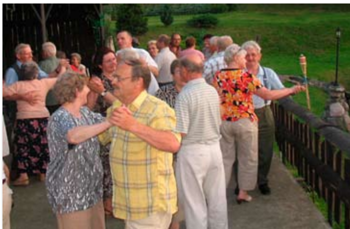
Emeryci na pikniku „U Leszka”.