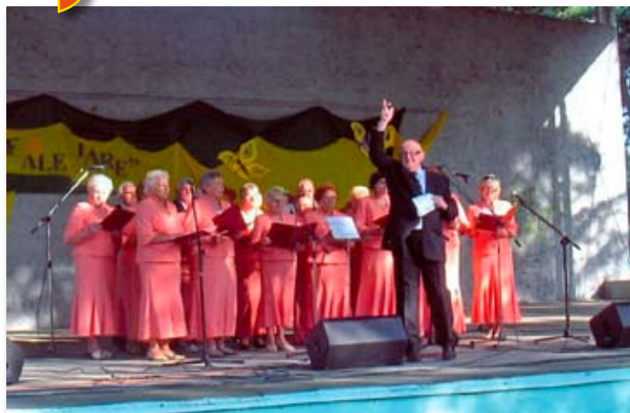
Harfa w Obornikach.