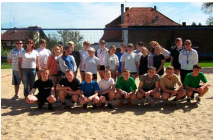
Turniej piłki plażowej w ramach Kampanii Zachowaj Trzeźwy Umysł.