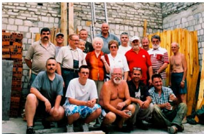
Zakończenie kolejnego etapu rozbudowy siedziby bractwa w Skokach.