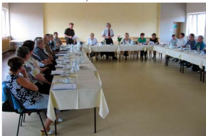
Spotkanie sołtysów z Burmistrzem.