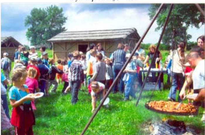
Piknik w Fundacji.