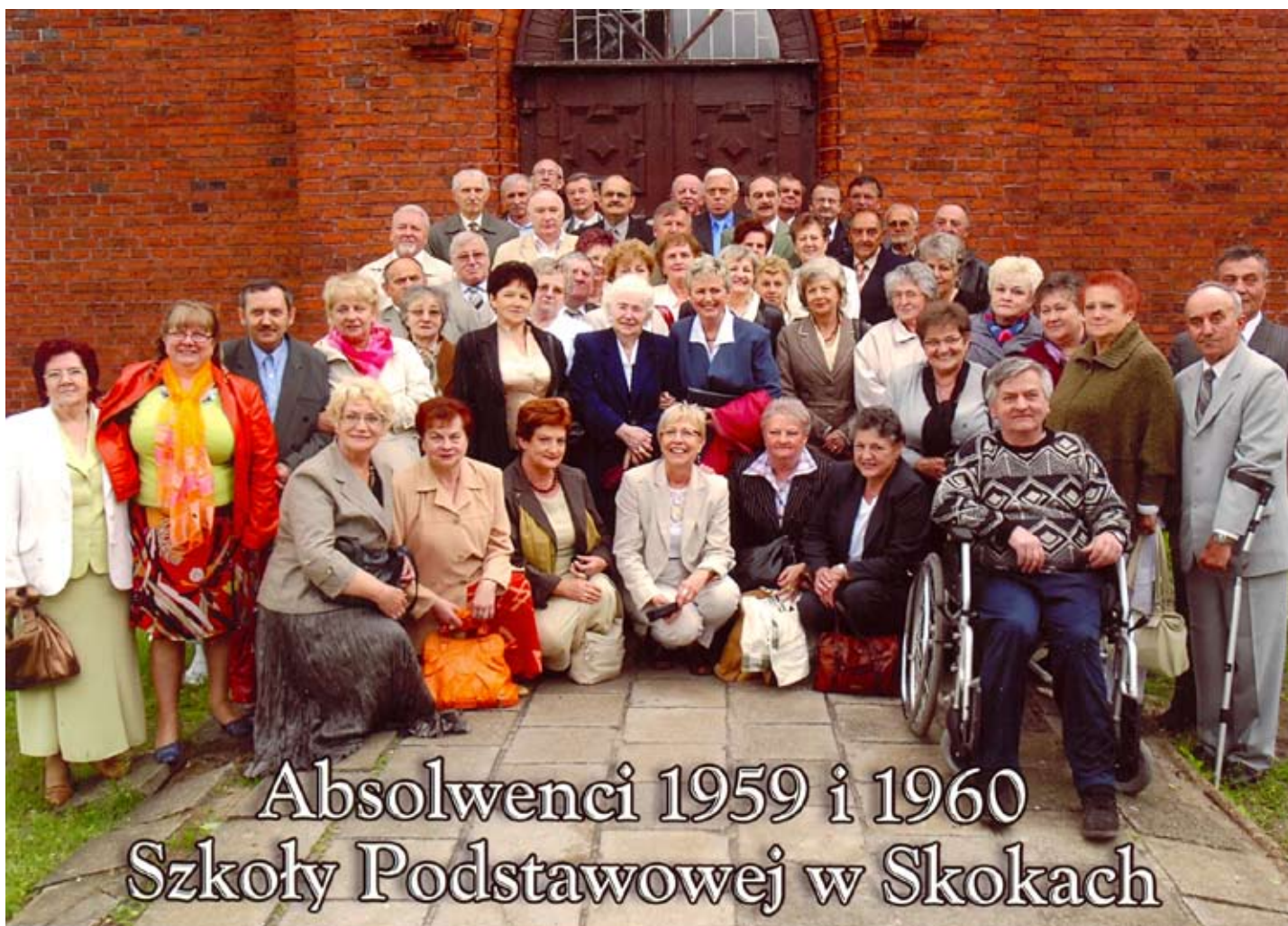
Absolwenci 1959 i 1960 Szkoły Podstawowej w Skokach