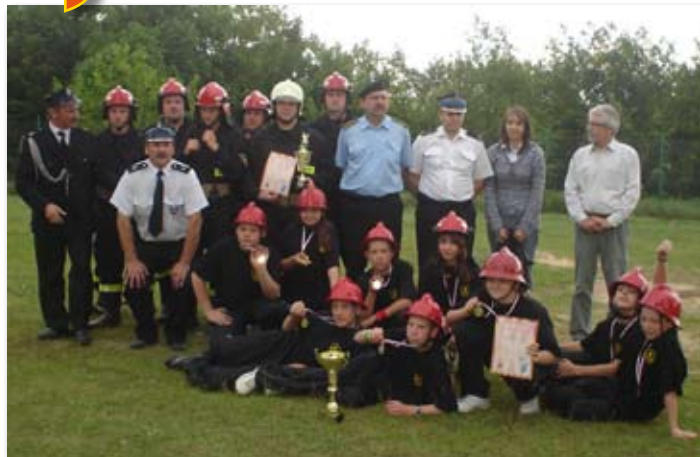
Miejsko-Gminne zawody pożarnicze w Lechlinie.