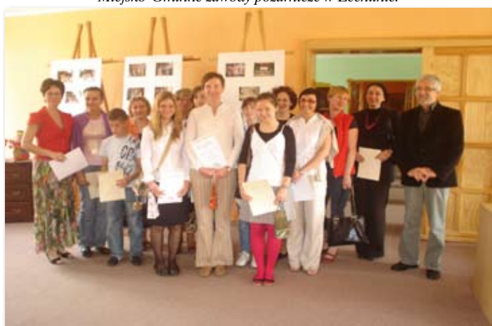
Laureaci Konkursu Ortograficznego „O Pióro Burmistrza”.