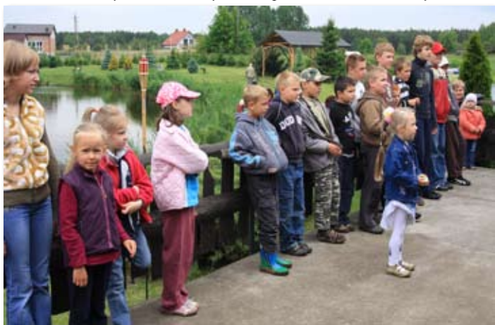
Wędkarski piknik z okazji Dnia Dziecka.