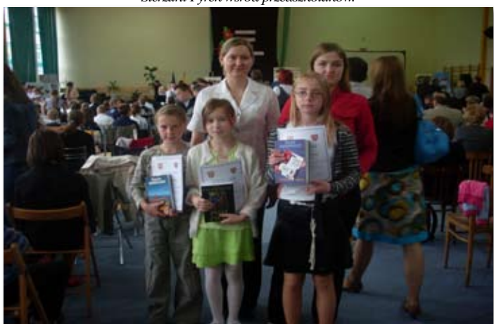
Uczestnicy konkursu wiedzy o Wielkopolsce - uczniowie Fundacji.