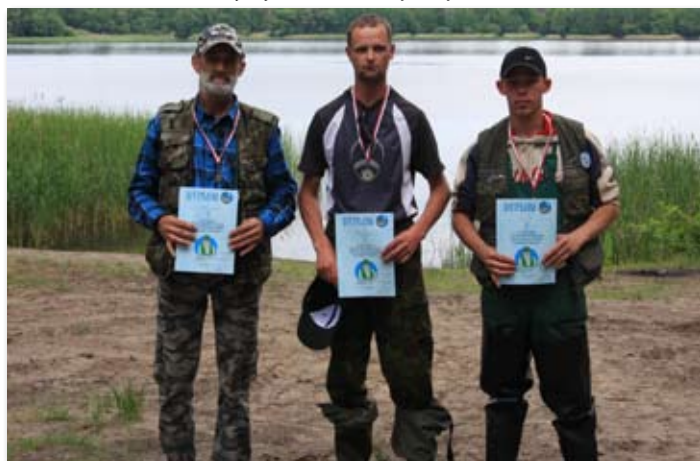
Zawody o tytuł Mistrza Koła PZW w Skokach.