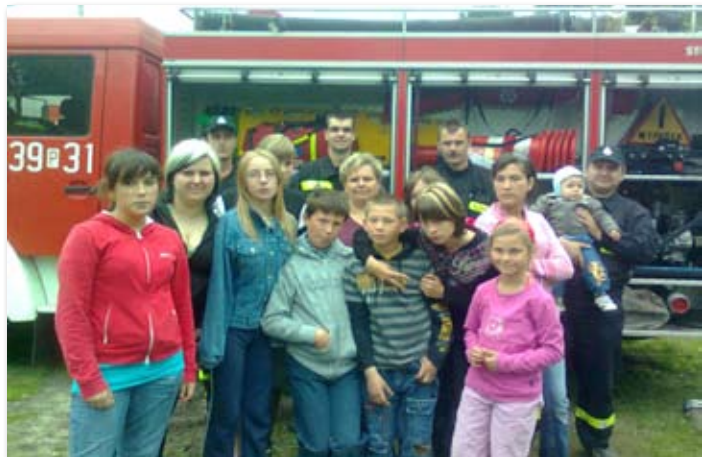
Dzień Matki i Ojca w sołectwie Glinno.