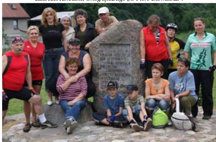
Uczestnicy rajdu na Dziewiczą Górę ze Skoków.