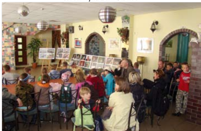
Rajd rowerowy z okazji Dnia Ziemi.