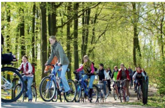
Rajd rowerowy z okazji Dnia Ziemi.