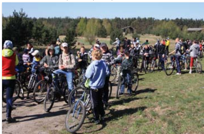
Rajd rowerowy z okazji Dnia Ziemi.