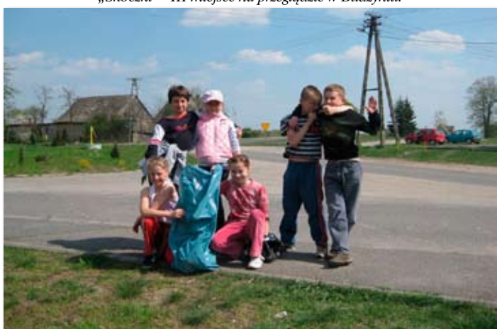
Uczniowie szkół Fundacji - Sprzątanie Świata.