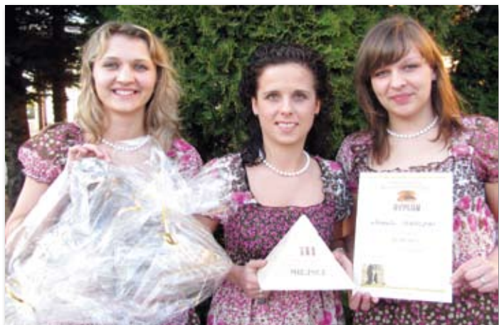
„Skoczki” - III miejsce na przeglądzie w Budzynie.