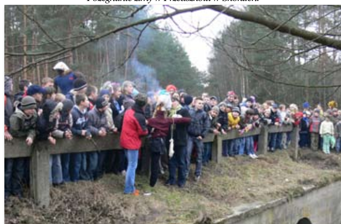
Topienie Marzanny w Szkole Podstawowej w Skokach.