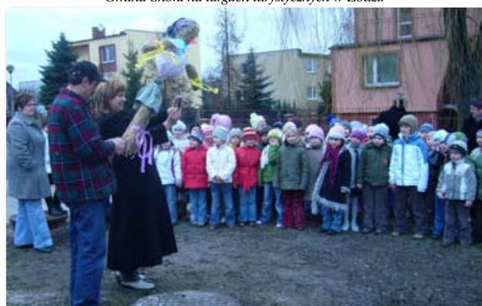
Pozegnanie zimy w Przedszkolu w Skokach.