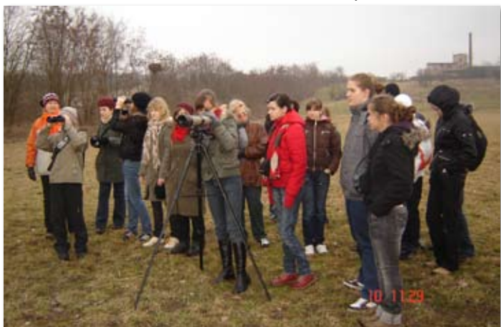
Warsztaty Przyrodnicze finalistów konkursu Poznajemy Parki Krajobrazowe Polski.