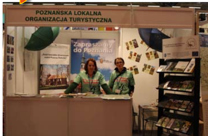
Gmina Skoki na targach turystycznych w Łodzi.