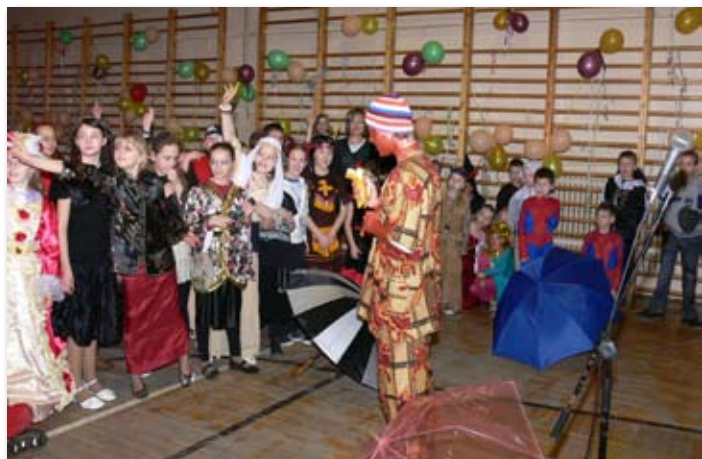
Bal przebierańców w Szkole Podstawowej w Skokach.