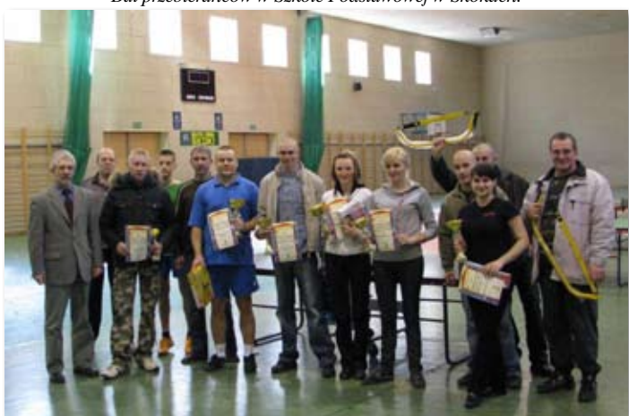
Mistrzostwa Gminy w tenisie stołowym w Gimnazjum.