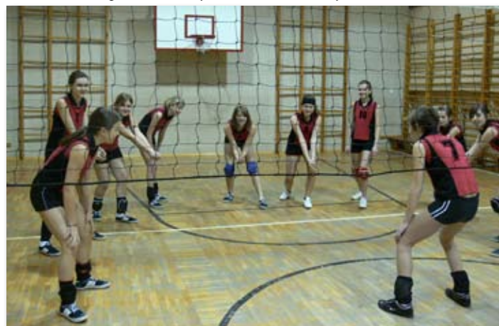
Zajęcia w sali Szkoły Podstawowej w Skokach - piłka siatkowa.