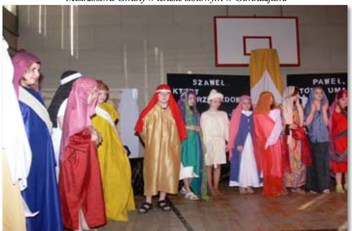
Przedstawienie o św. Pawle w Szkole Podstawowej w Skokach.