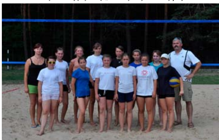
Siatkarki plażowe ze skockiego Gimnazjum.