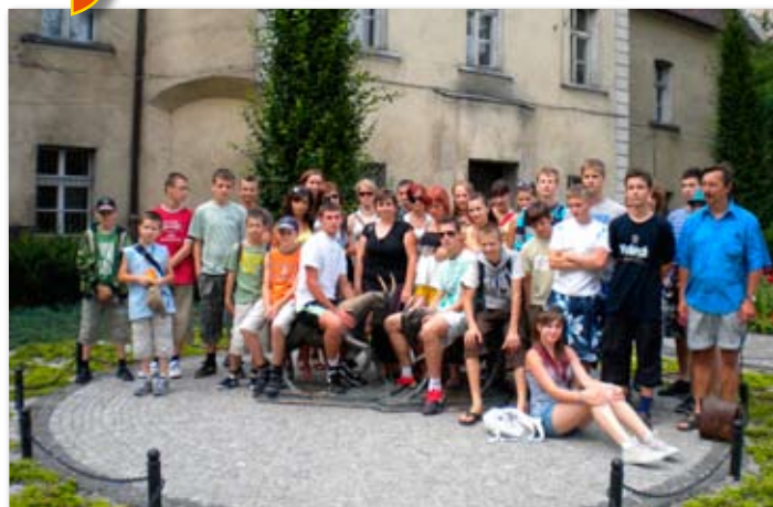
Młodzież z zalanej wodą Gminy Dwikozy na wakacjach w Skokach.