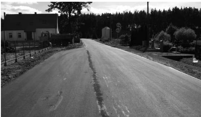
Potrzeznowo - ulica Szkolna.

179 wniosków w tym 178 wniosków o przyznanie stypendium i 1 wniosek o przyznanie zasiłku.