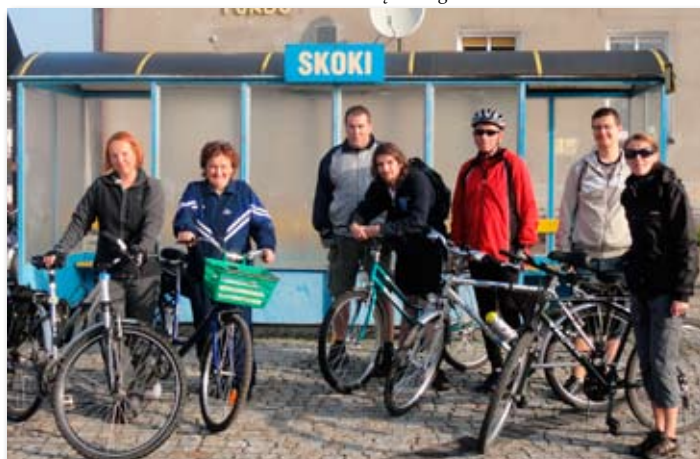
Najbardziej wytrwali rowerzyści na starcie IV Cysterskiego Rajdu Rowerowego.