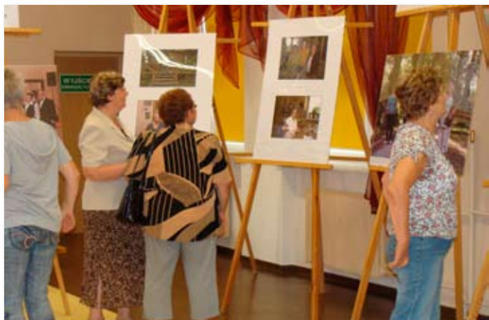
Seniorzy zwiedzają wystawę: „Seniorzy - my też mamy pasje”.