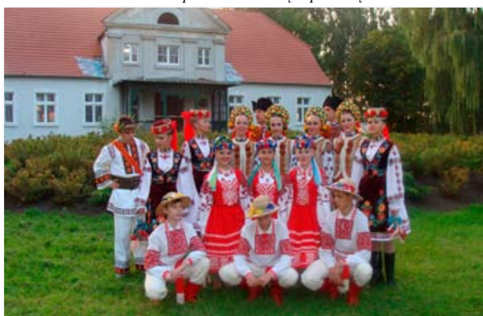
I Festiwal Zespołów Ludowych - Zespół z UKRAINY - KVITY UKRAYINY.