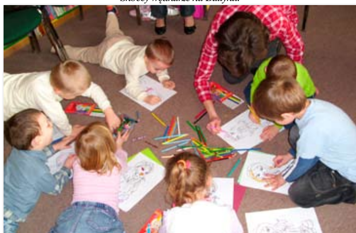
Klub Molika Książkowego.