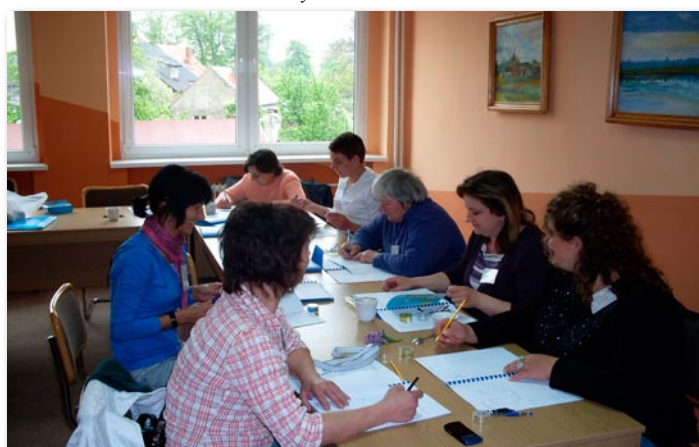
Program "Lepsze jutro" w OPS w Skokach.