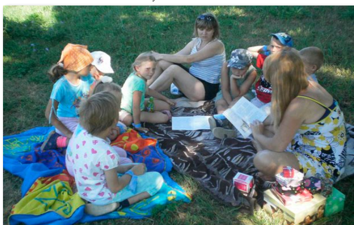
Półkolonia w Jabłkowie.