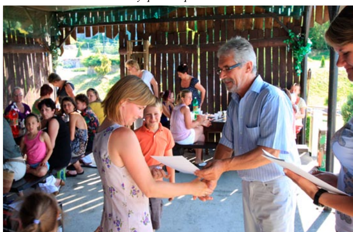
Podsumowanie konkursu "Piękna i Zielona Gmina 2010".