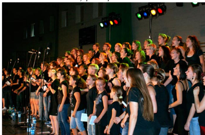
Koncert gospel w hali w Skokach.