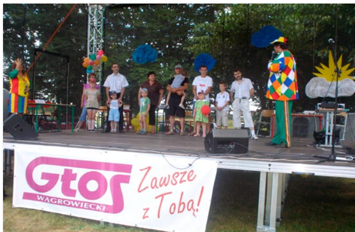
Festyn w Jabłkowie.