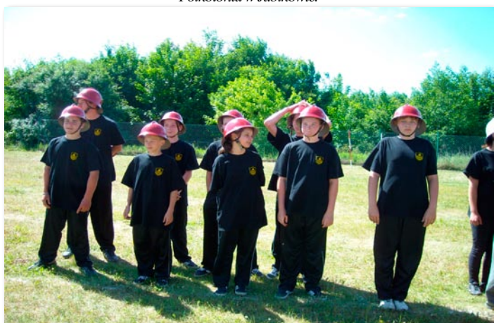
Gminne zawody sportowo-pożarnicze w Lechlinie.