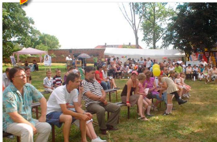
Festyn w Jabłkowie.