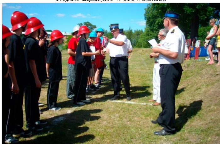
Gminne zawody sportowo-pożarnicze w Lechlinie.