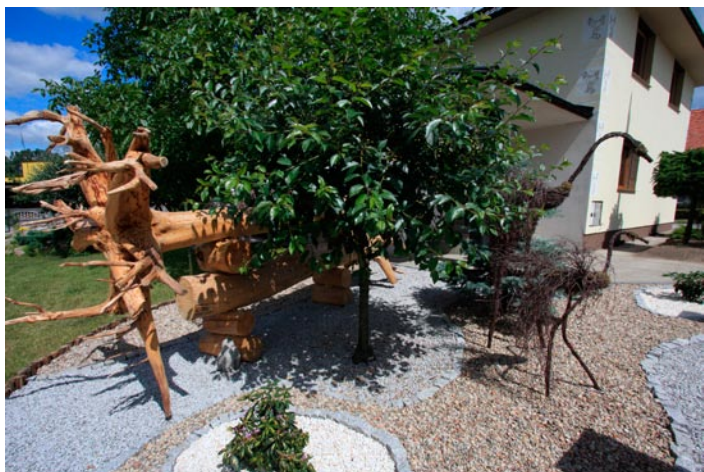
Renata i Artur Kruś - Skoki.