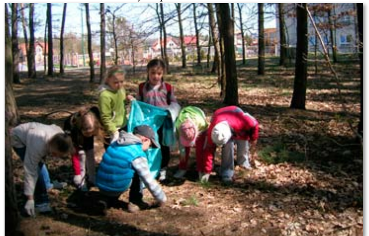
Różnorodność w nas, bioróżnorodność wokół nas.