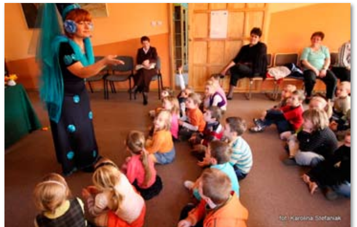
Skoccy przedszkolacy na spotkaniu z Dobrą Wróżką.