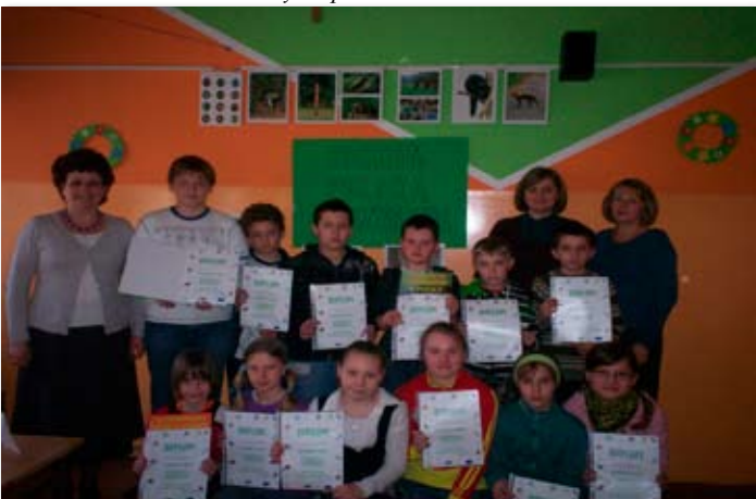
Konkurs przyrodniczy "Kocham Polską Przyrodę".