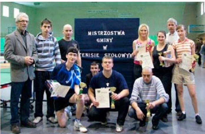
Mistrzostwa Gminy w tenisie stołowym.