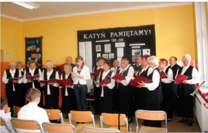
Niezwykłe spotkanie w Jabłkowie.