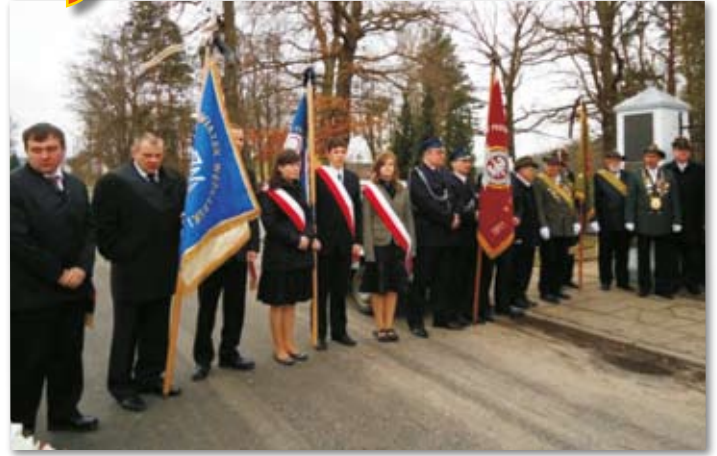
Poczty sztandarowe na uroczystościach 10.04.