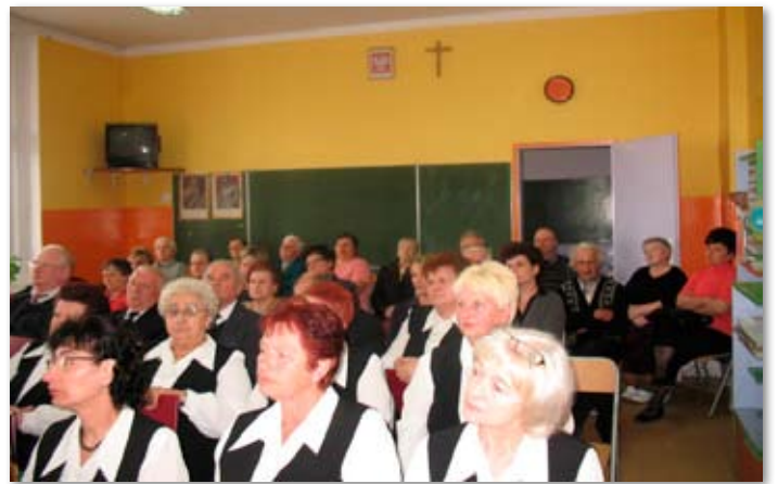
Niezwykłe spotkanie w Jabłkowie.