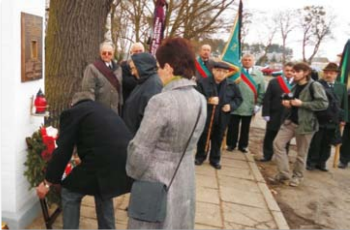
Złożenie kwiatów przy tablicy upamiętniającej zbrodnię katyńską.