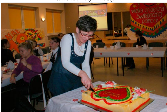
Spotkanie z wolontariuszami XVIII WOŚP.