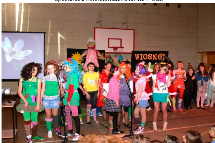
Święto Wiosny w Szkole Podstawowej w Skokach.