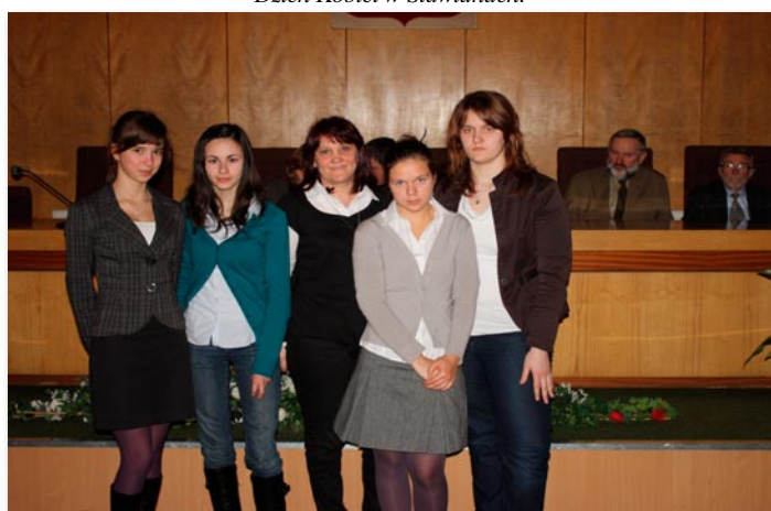
Finalistki wielkopolskiego konkursu Poznajemy Parki Krajobrazowe Wlkp.