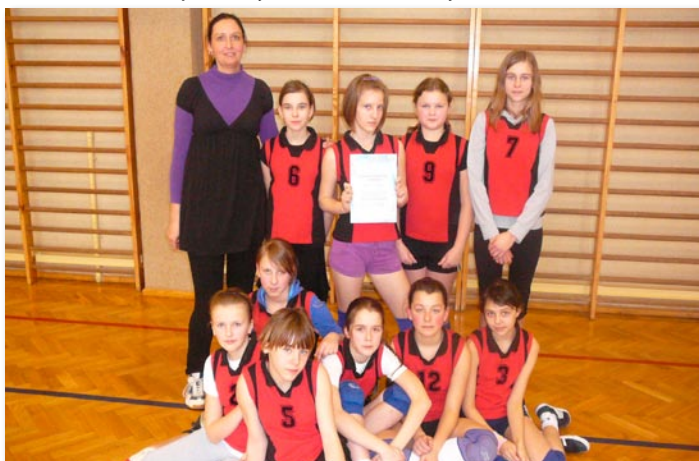
Turniej siatkówki w Szkole Podstawowej w Skokach.