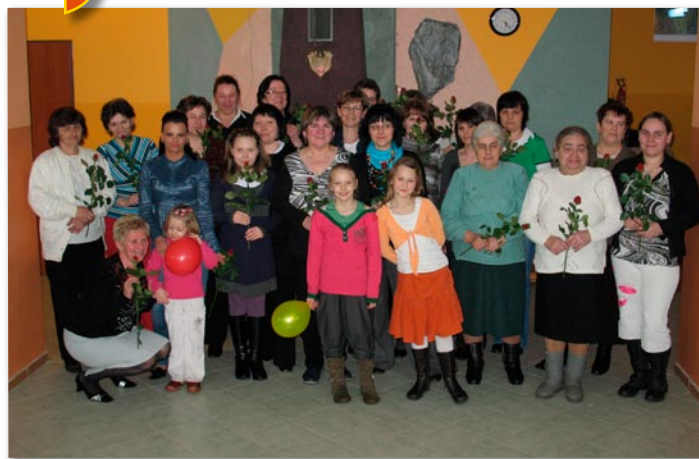
Dzień Kobiet w Stawianach.