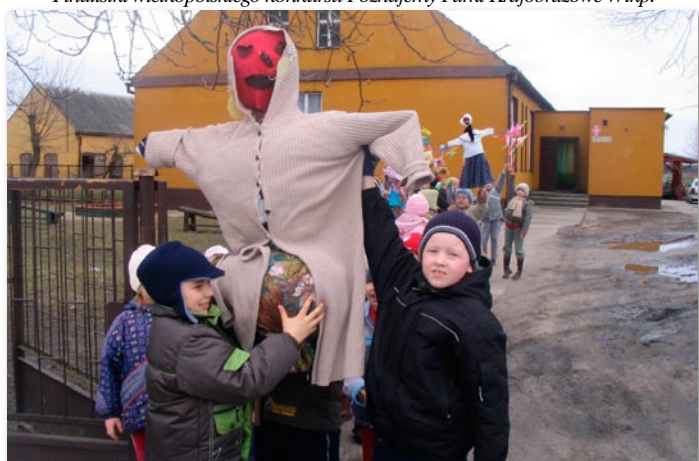
Topienie Marzanny w Szkole Podstawowej w Łosińcu.