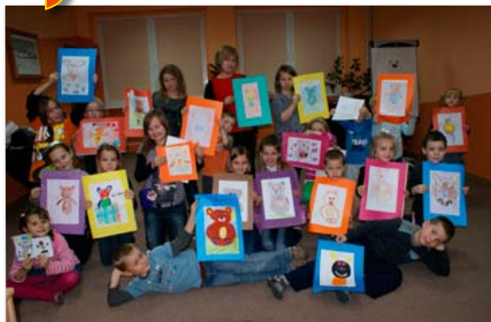
Urodziny pluszowego Misia w Bibliotece.