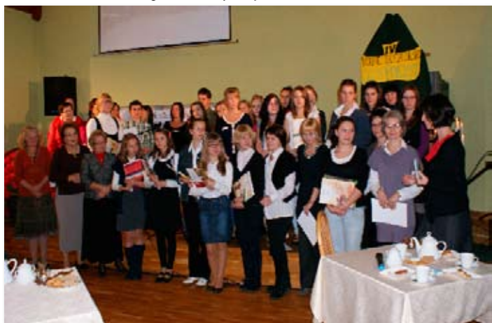
Święto 11 listopada w SzP w Skokach.