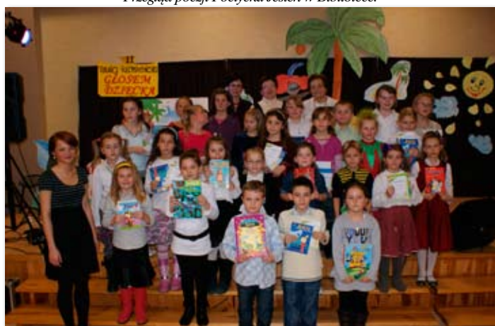
II Turniej Recytatorski Głosem Dziecka w Bibliotece.