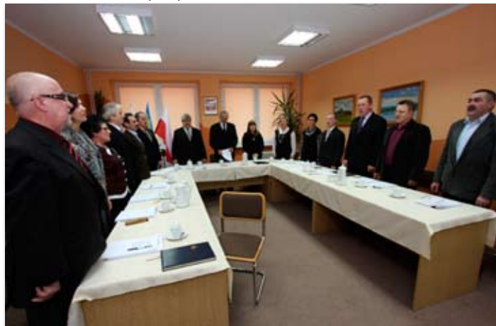
I sesja VI kadencji Rady Miejskiej Gminy Skoki.