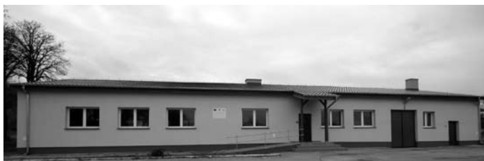
Świetlica w Rościnnie.