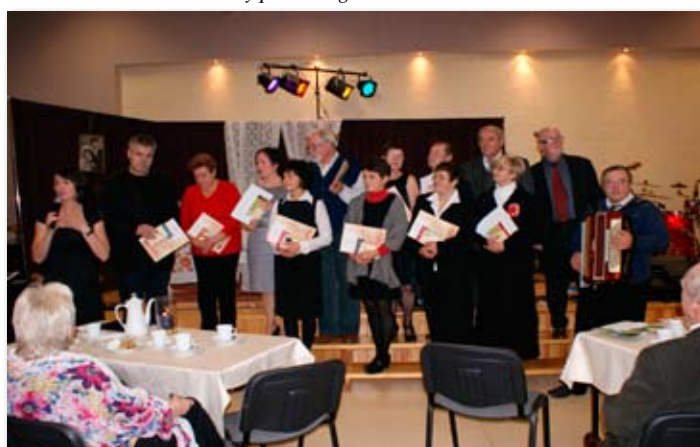
Przegląd poezji Poetycka Jesień w Bibliotece.