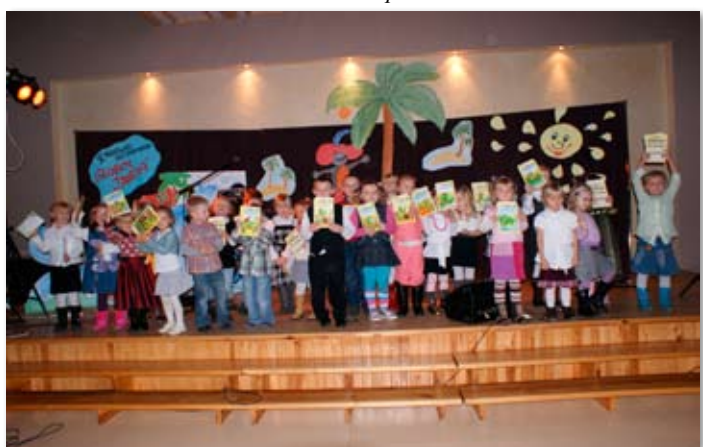
Przegląd Poezji Głosem Dziecka.