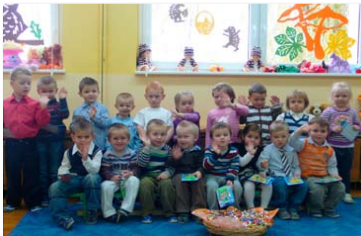
Pasowanie na Przedszkolaka w przedszkolu w Skokach.