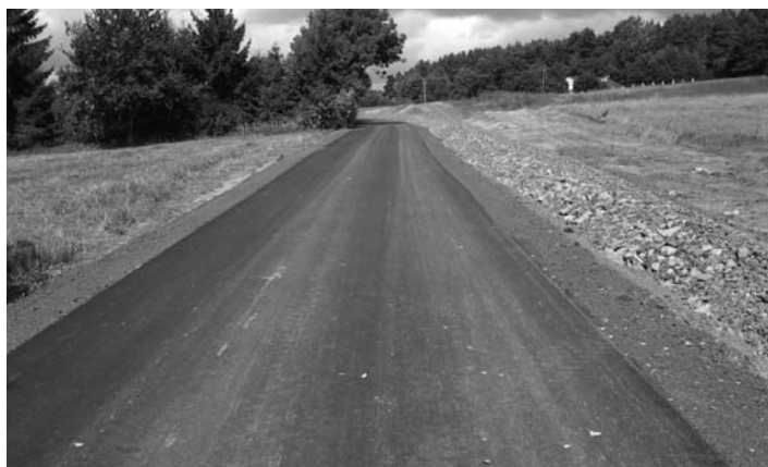
Ul. Smolarki w Potrzezanie