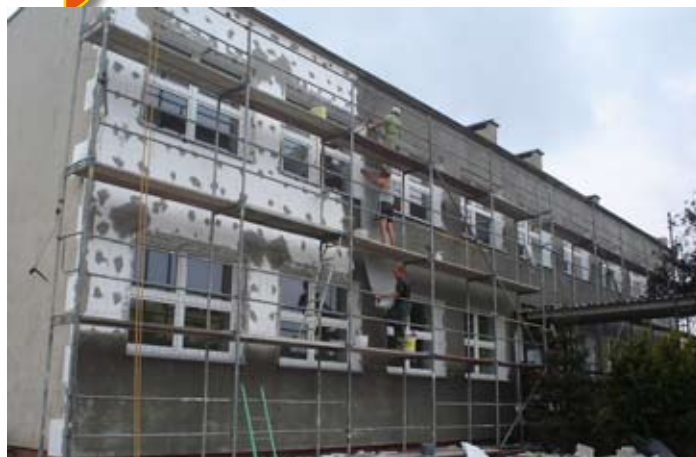
Termomodernizacja przedszkola w Skokach.