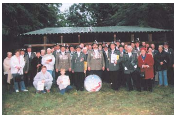
Turniej Żniwny Bractwa Kurkowego w Skokach.