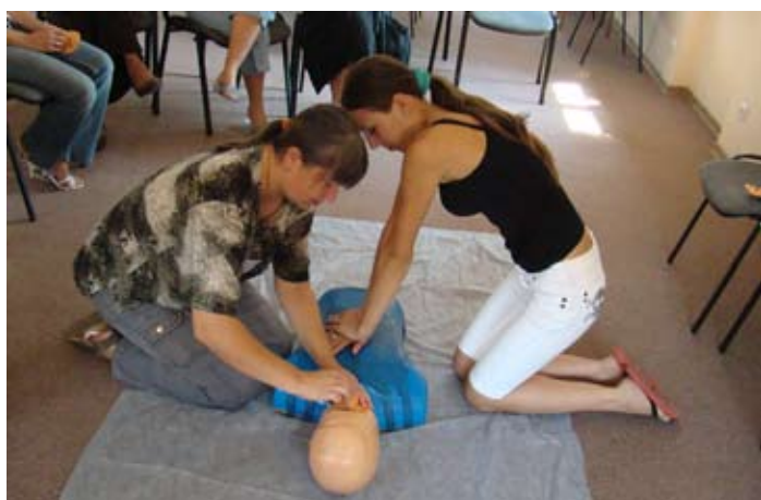
Projekt "Lepsze Jutro" w OPS w Skokach.