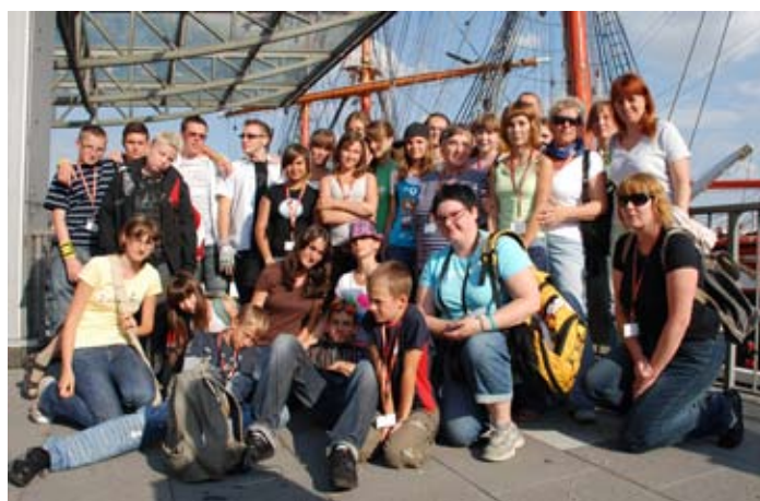
Obóz młodzieżowy w Bardowick.