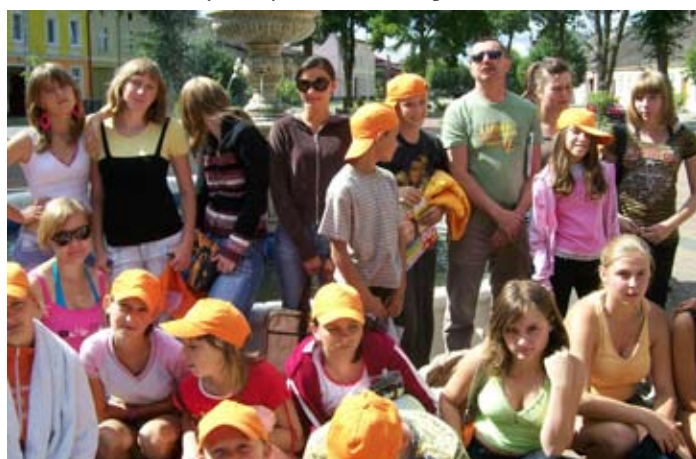
Na kolonii jest wesoło.