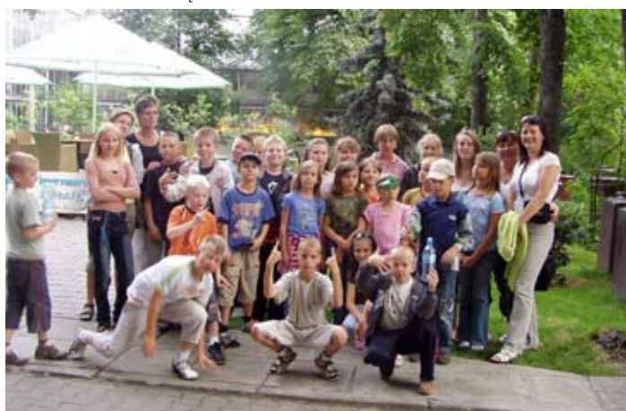
Wycieczka wakacyjna w Szkole Podstawowej w Skokach.