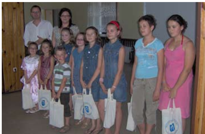
Wioska internetowa tętni życiem.