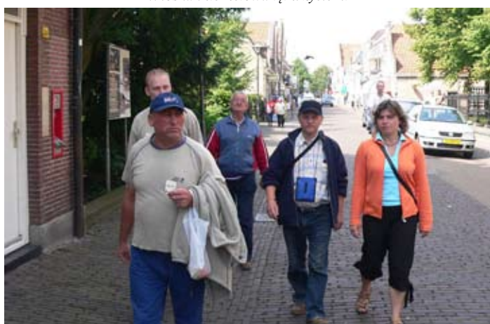
Wędkarze Koła PZW Skoki w Holandii.