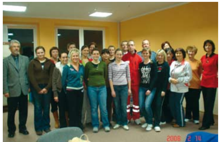
Podsumowanie szkolenia Bezpieczna Kobieta