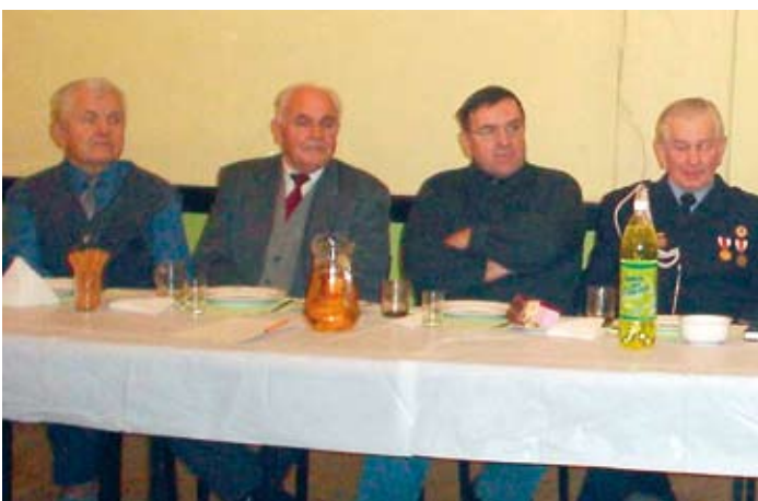
Strażacy seniorzy - członkowie honorowi przysłuchiwali się sprawozdaniu Zarządu