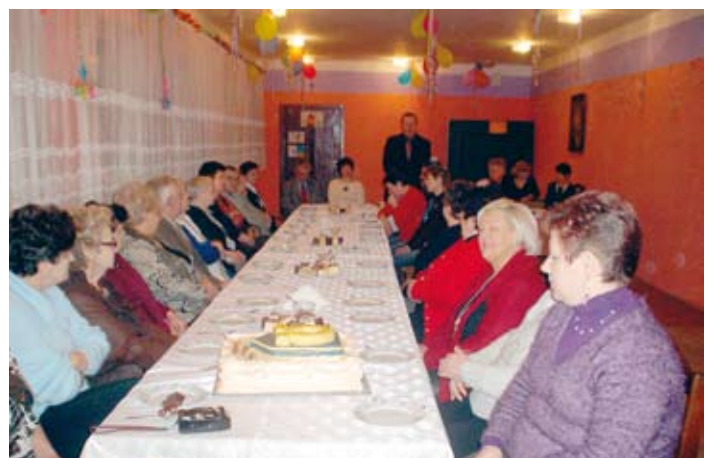
Dzień Babci i Dziadka w Potrzebowie