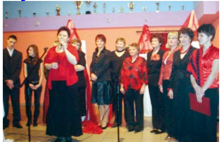
Walentynki z Kołem Gospożyn w Potrzebowie