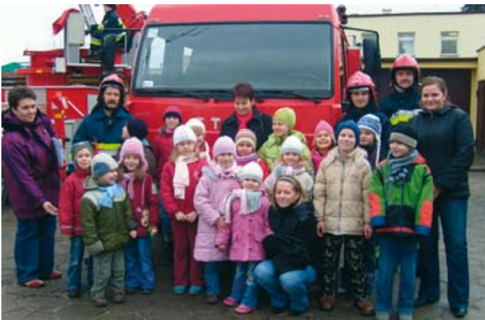
Ferie z Biblioteką Publiczną w Skokach