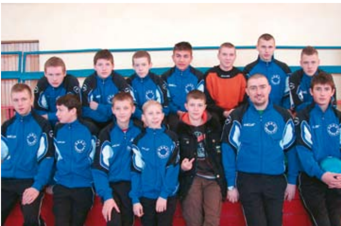
Trampkarze Stasi Welny Skoki na turnieju w Żninie