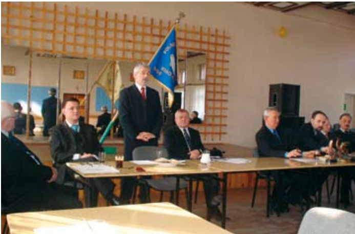
Walne Zebranie Koła Wędkarskiego w Skokach