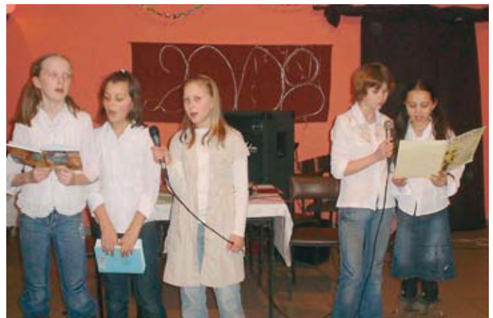
Wnuczenta dla Babć i Dziadków w Potrzebowie