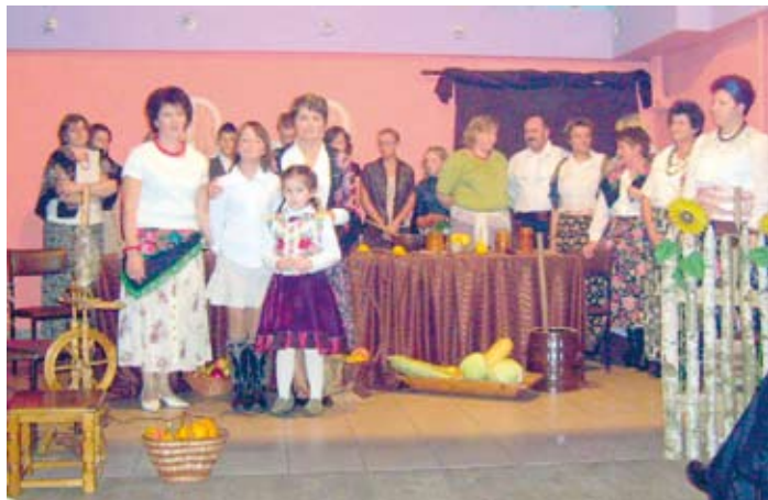
Wieś w poezji w Potrzebnowie.