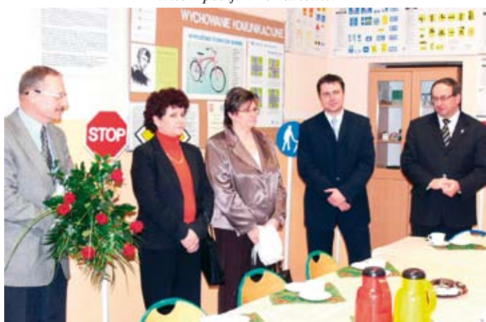
Uczniowie Szkoły Podstawowej zyskali pięknie wyposażony gabinet.