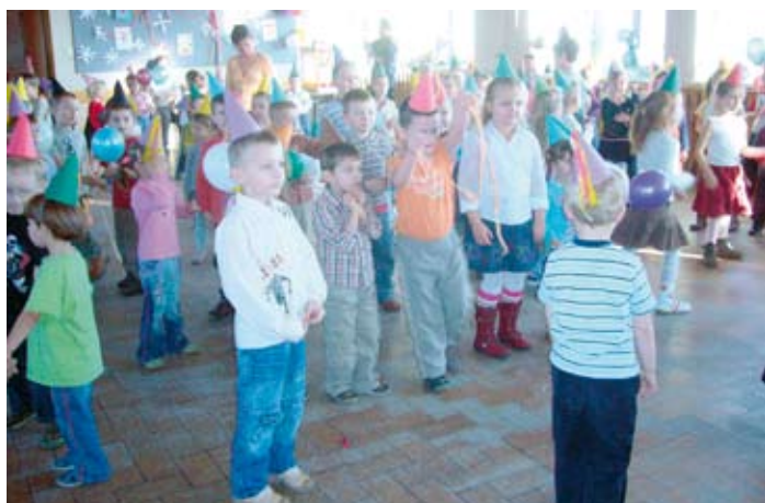
Zabawa andrzejkowa w przedszkolu.