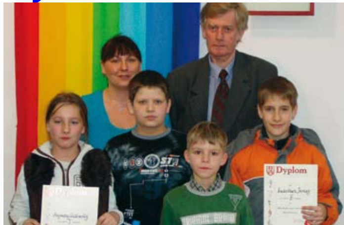
Nasi reprezentanci w Mikołajkowym Turnieju Warcabowym.