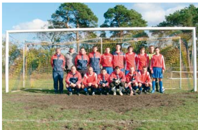
Pierwsza drużyna Wehny w towarzystwie trenera i kierownika zespołu.