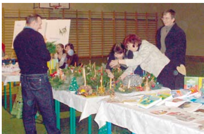
Kiermasz Bożonarodzeniowy w Gimnazjum.