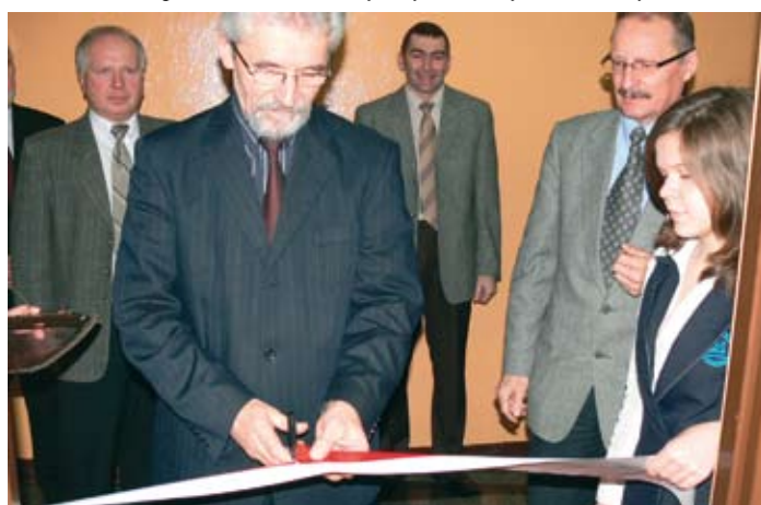
Otwarcie sali do wychowania komunikacyjnego.