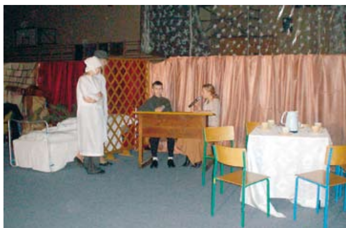
Kiermasz Bożonarodzeniowy w Gimnazjum.