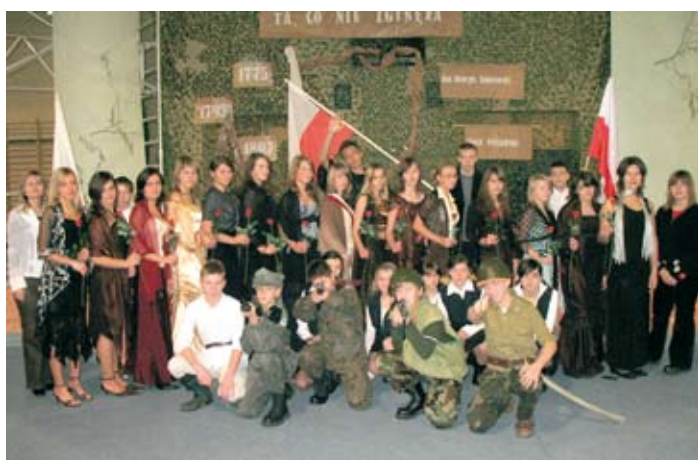
Apel w gimnazjum z okazji Święta Niepodległości.