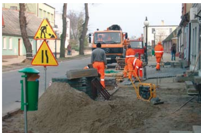
Nowe chodniki przy ul. Kazimierza Wielkiego w Skokach.