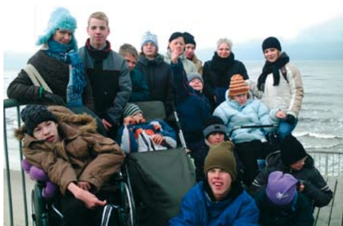
Niepełnosprawne dzieci z Fundacji nad morzem.