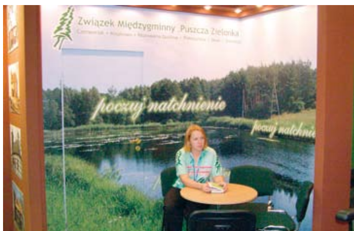
Stoisko MiG Skoki na MTP Tour Salon w Poznaniu.