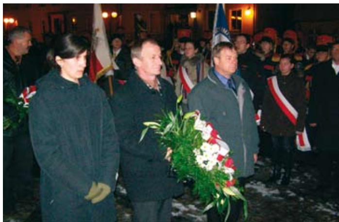
Obchody Dnia Niepodległości 11 listopada w Skokach