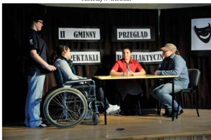
II Gminny Przegląd Teatrów Profilaktycznych.