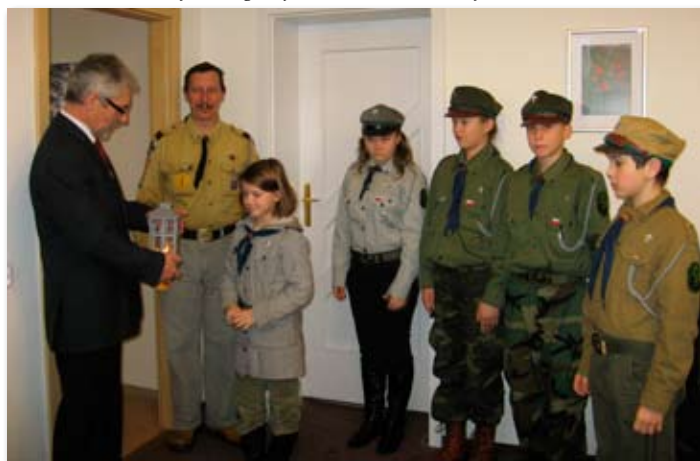
Harczerze ofiarowali Burmistrzowi Ogień Betlejema.