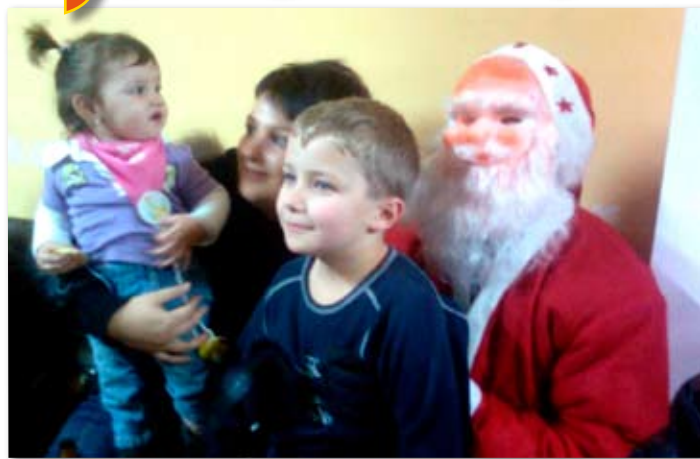
Mikołaj w Glinie.