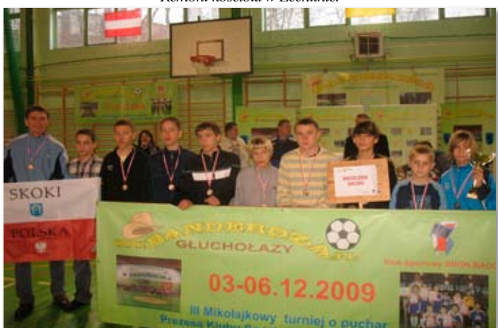
Drużyna UKS SKOCZEK zajęła 3 miejsce na turnieju w Głucholazach.