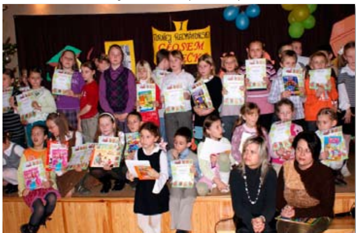
Gala Finałowa I Turnieju Recytatorskiego Głosem Dziecka.