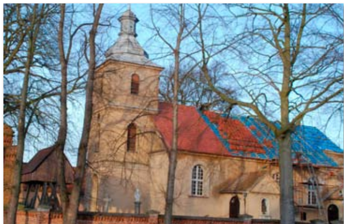
Remont kościoła w Lechlinie.