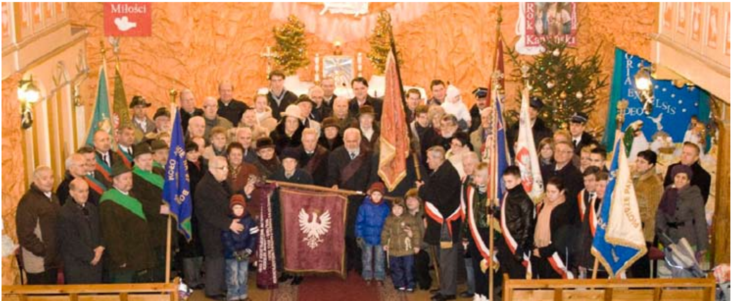
Sztandar skockich powstańców wielkopolskich oraz członkowie koła, zaproszeni goście i świadkowie uroczystości.

Wszystkie uroczystości patriotyczno-religijne gromadzą w naszym kościele nie tylko indywidualnych wiernych, ale także delegacje szkół oraz organizacji i stowarzyszeń działających na terenie naszego miasta i gminy wraz z reprezentującymi ich kilkunastoma pocztami sztandarowymi. Jak na niewielkie miasteczko i gminę to naprawdę imponująca i napawająca dumą liczba. Tym widocznym znakiem działalności nie mogło jak dotychczas poszczycić się jedno z najliczniej reprezentowanych miejscowych stowarzyszeń - Towarzystwo Pamięci Powstania Wielkopolskiego 1918/1919 Koło Skoki.