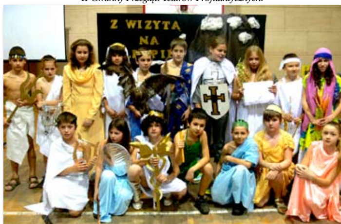
Turniej mitologiczny w Szkole Podstawowej w Skokach.