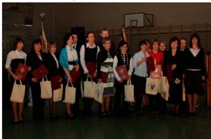
Wyróżnieni nauczyciele SzP w Skokach podczas Jubileuszu 90-lecia.