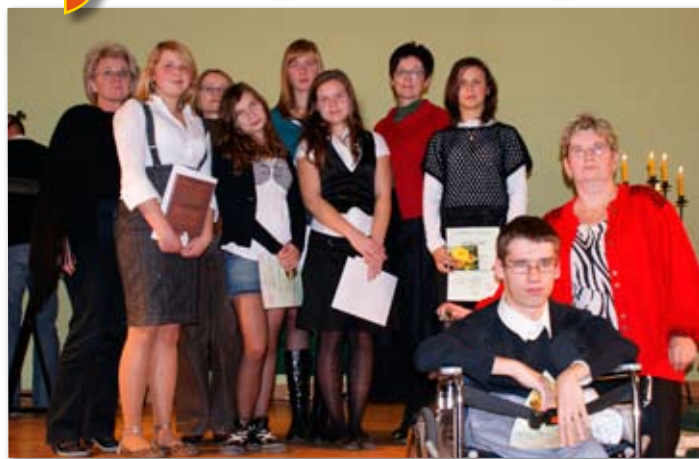
III Turniej recytatorski- Głos Poezji.