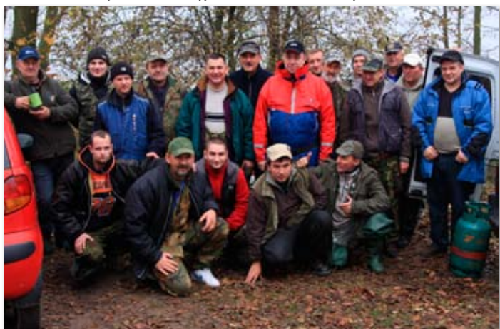
Uczestnicy zawodów wędkarskich Koła PZW nr 120 w Skokach.