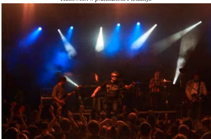
Koncert zespołu T-LOVE.