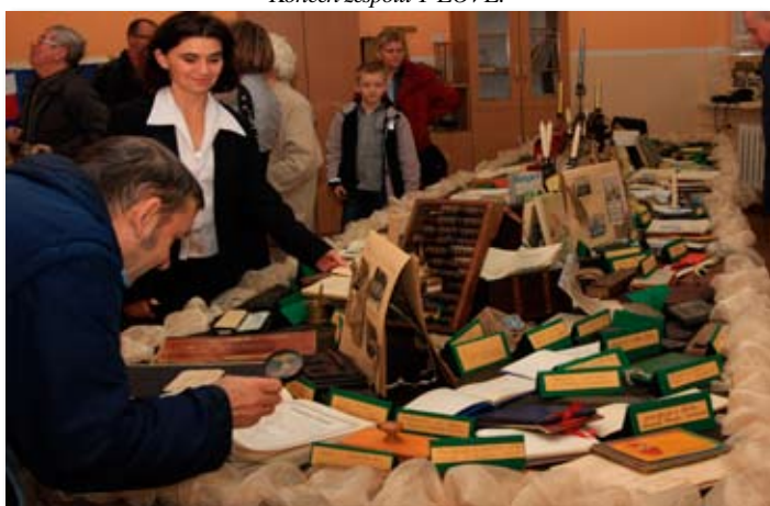
Pamiątkowa izba lekcyjna w Szkole Podstawowej w Skokach.