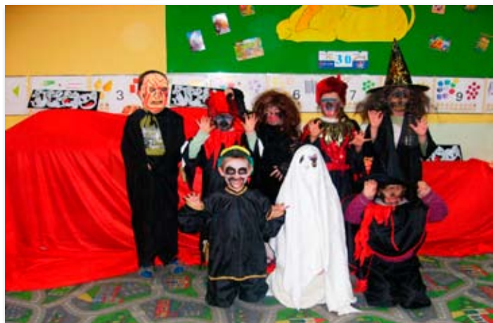
Halloween w przedszkolu Fundacji.