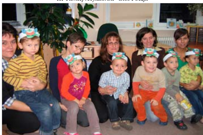
Moliki Książkowe w skockiej Bibliotece.