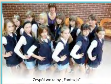
Zespół wokalny „Fantazja”