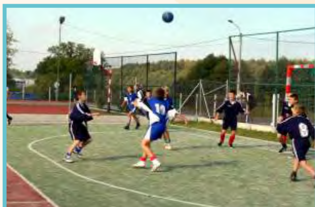
Boisko ze sztuczną nawierzchnią