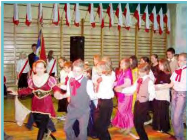
Święto Konstytucji 3 Maja