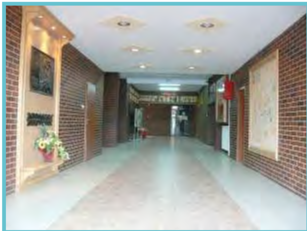
Główny hol szkoły