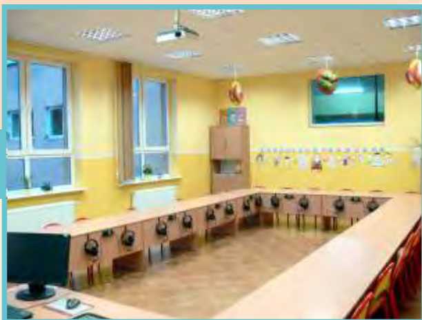
Sala językowa dla klas I - III