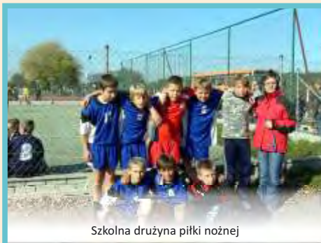
Szkolna drużyna piłki nożnej