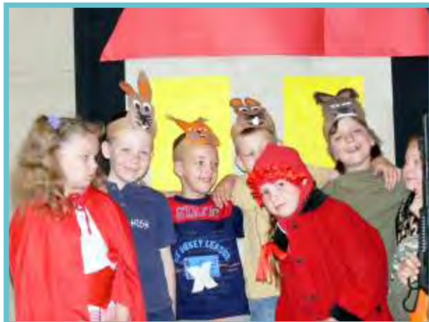
Konkurs „Czy znam bajki”