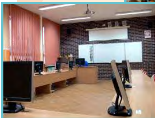
Sala komputerowa dla klas I - III