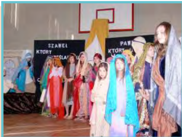
Przedstawienie o Św. Pawle