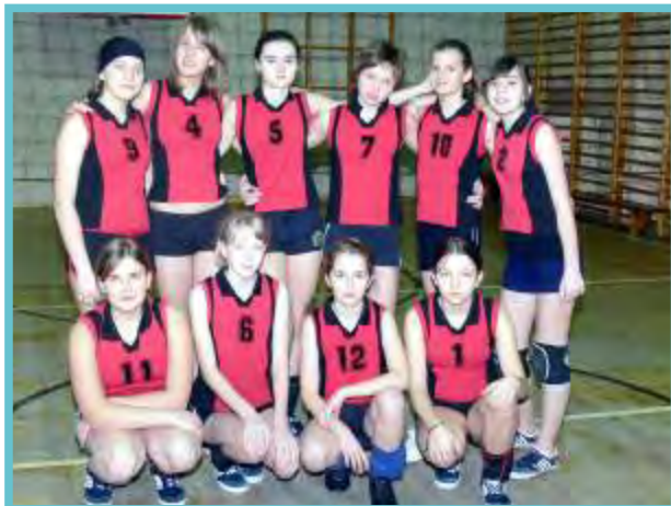
Szkolna drużyna siatkówki