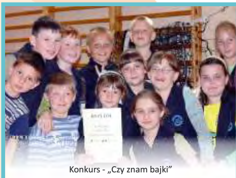
Konkurs - „Czy znam bajki”