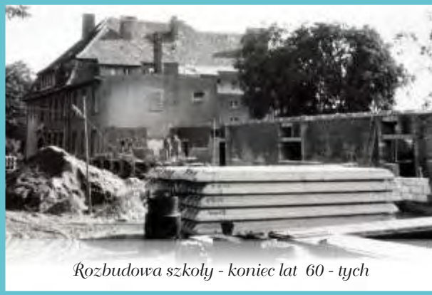
Rozbudowa szkoły - koniec lat 60 - tych