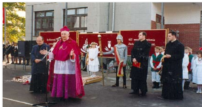
1992 rok – Poświęcenie budynku Szkoły Podstawowej

Bliżyce – zakończono wodociągowanie wsi; wykonano przyłącze wodociągowe do Szkoły Podstawowej; Wysoka – przełożono rurociąg i dokonano naprawy przepustów; Potrzeznowo – wykonano sieć wodociągową łączącą studnię głębinową z punktem poboru wody (200 m); Przejęto od Skarbu Państwa hydrofornie w Brzeźnie, Roszkowie i Stawianach ; Jabłkowo - rozpoczęto budowę sieci wodociągowej; Rościnnno - rozpoczęto budowę wodociągu w Rościnnie;