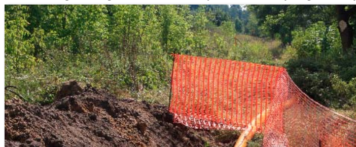
2009 rok – budowa gazociągu w Skokach

Skoki – budowa gazociągu średniego ciśnienia (I etap), budowa dwóch budynków komunalnych z 8 lokalami socjalnymi (I etap), modernizacja oczyszczalni ścieków (w tym wymiana pompy, instalacji napowietrzającej, mieszadeł i in.), modernizacja budynku OSP (II etap – remont generalny kuchni), dofinansowanie zakupu ciężkiego samochodu ratowniczo-gaśniczego dla OSP Skoki, wymiana instalacji odgromowej