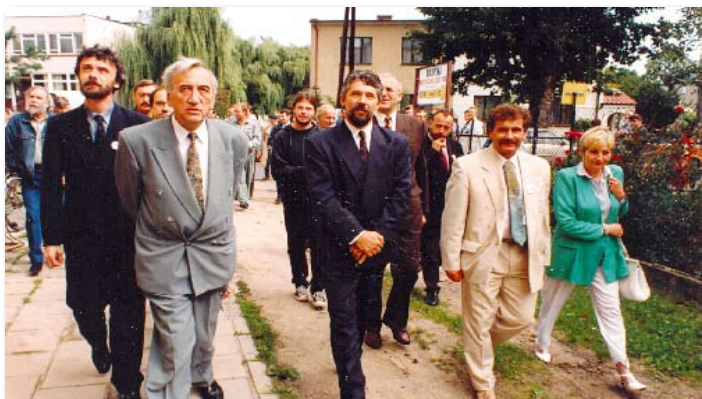
1993 rok – wizyta Tadeusza Mazowieckiego w Skokach

wybudowano wodociąg o długości 6.850 mb (1993-1994r.);