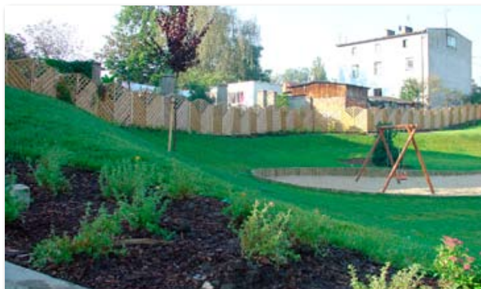
2007 rok – plac zabaw w Skokach

Potrzeznowo – budowa podbudowy ul. Włókna (1.799 mb), budowa podbudowy ul. Smolarki (1.750 mb)