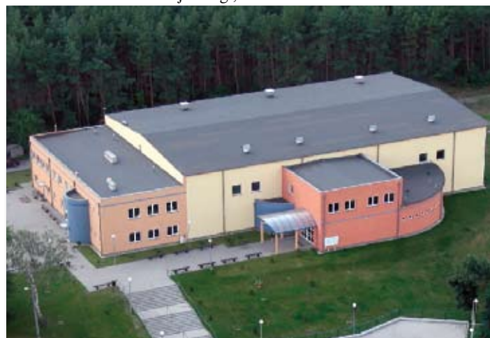
2002 rok – hala widowiskowo-sportowa w Skokach

Skoki – zakończenie budowy hali widowiskowo – sportowej (ostatnia płatność w 2009 r.).