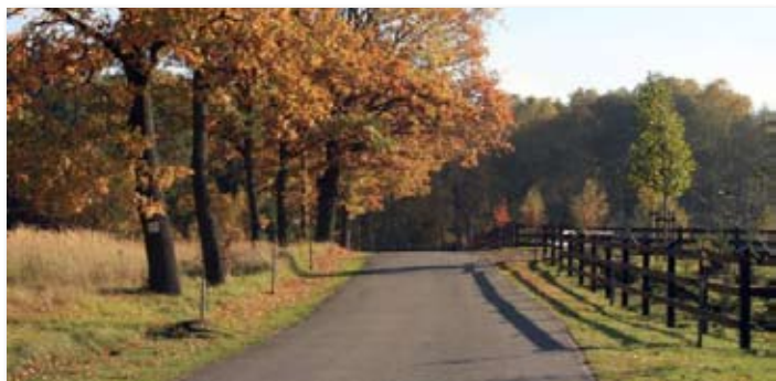
2004 rok – Gmina Skoki

Budziszewice – budowa wodociągu wsi (I etap – 2.040 m sieci wraz z przyłączami), budowa nawierzchni asfaltowej drogi (II etap); Szczodrochowo – Sława – budowa nawierzchni asfaltowej drogi (1.394 mb); Potrzeznowo – budowa podbudowy drogi (w kierunku Pałacu – 1.263 mb); Lechlin – budowa chodnika od Kościoła do wsi (235 mb); Rejowiec – generalny remont Szkoły Podstawowej;