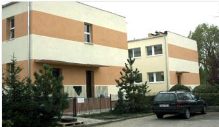
2008 rok – Przedszkole Samorządowe w Skokach

Dojazd (1.146 m sieci), budowa kanalizacji sanitarnej (419 m) i wodociągu (242 m), na terenach budowlanych pomiędzy ul. Zamkową i Wągrowiecką, budowa kanalizacji sanitarnej (281 m) i wodociągu