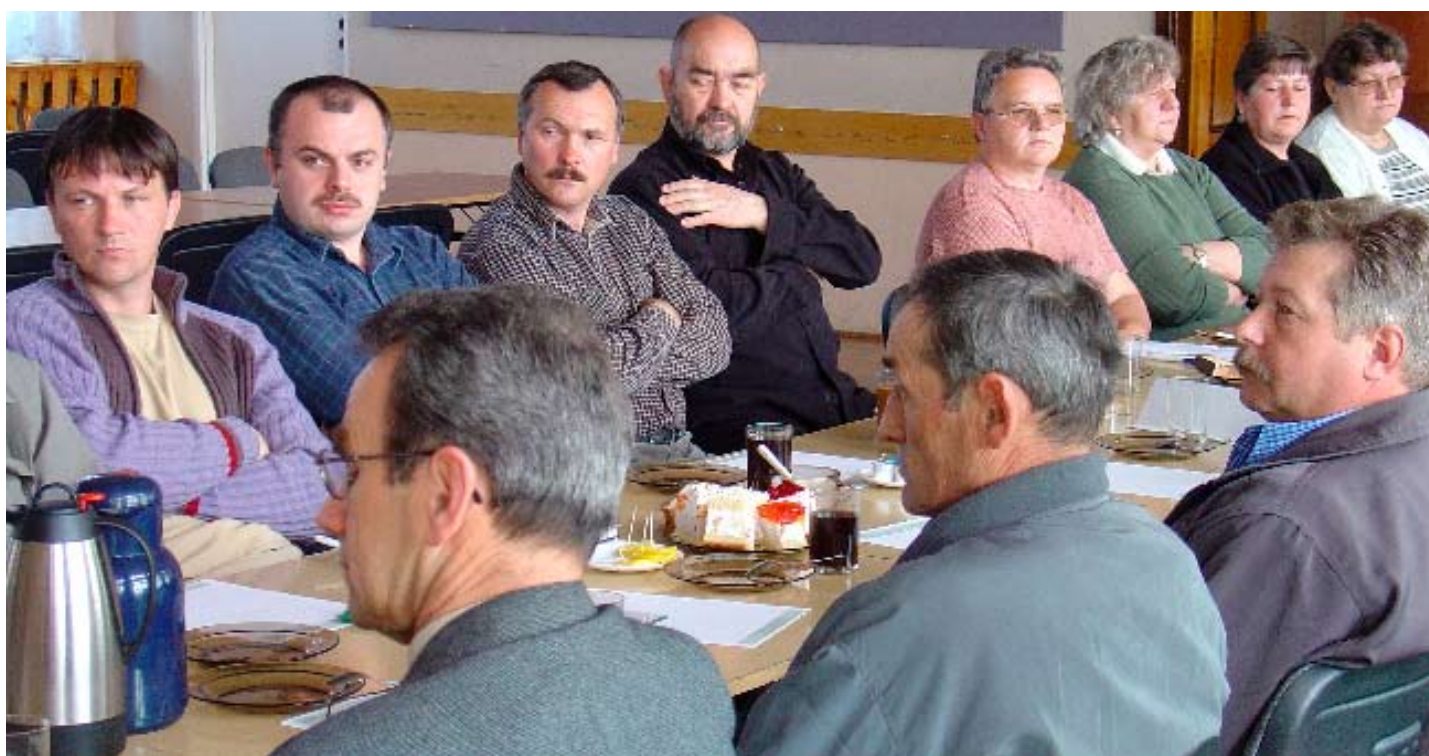
Zebranie sołtysów w dniu 28.04.2006r.