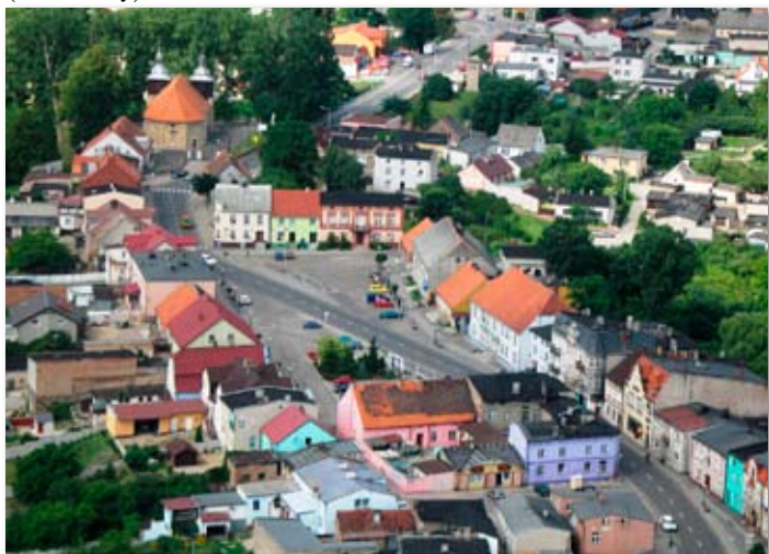
1994 rok – Skoki z lotu ptaka

Jabłkowo – wybudowano pomieszczenia socjalne Szkoły Podstawowej (sanitariaty);