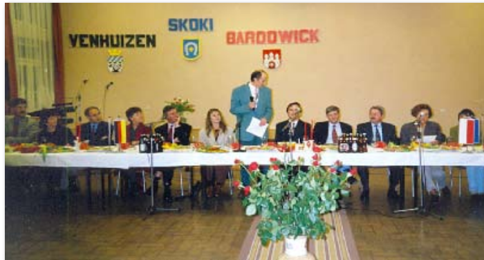
1995 rok – podpisanie umowy partnerskiej Skoki – Bardowick – Venhuizen

Łosiniec – ułożono nawierzchnię asfaltową drogi;